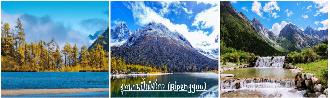
อุทยานเป่ฝิ่งโกว (Bipehggou)