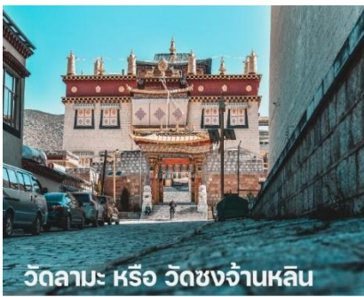
วัดลามะ หรือ วัดชงจ้านหลิน