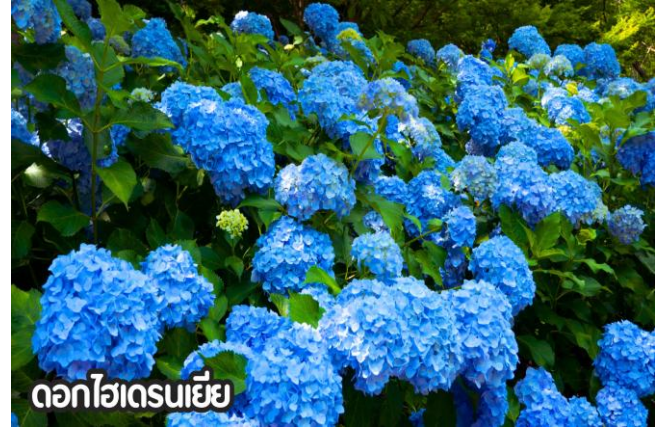
ดอกไฮเดรนเยีย

**หมายเหตุ: โปรแกรมชมดอกไม้ช่วงเดือน พ.ค. - ต.ค.2569 ในช่วง ณ วันเดินทางดังกล่าว หากดอกไม้ยังไม่บานหรืออาจจะร่วงหล่น..ทั้งนี้ขึ้นอยู่กับสภาพอากาศของแต่ละปี ทางบริษัทไม่การันตีและไม่สามารถกำหนดการบานของดอกไม้ได้ ทางบริษัทฯ ขอสงวนสิทธิ์ปรับเปลี่ยนรายการท่องเที่ยวอื่นทดแทนนะคะ รบกวนท่านโปรดทราบและทำความเข้าใจคะ**