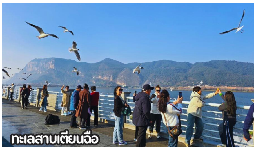
ทะเลสาบเตียนจิว

จากนั้นเดินทางสู่ ทะเลสาบเตียนจิว (Dianchi Lake) หรือทะเลสาบคุนหมิง ทะเลสาบปิดขนาดใหญ่ ตั้งอยู่ติดกับเมืองคุนหมิง เป็นทะเลสาบน้ำจืด ตั้งอยู่ที่ระดับความสูง 1,886.5 เมตรเหนือระดับน้ำทะเล มีพื้นที่ 298 ตารางกิโลเมตร ยาวจากเหนือจรดใต้ 39 กิโลเมตร ลึก 4.4 เมตร ลักษณะของทะเลสาบมีรูปร่างคล้ายกับพระจันทร์เสี้ยว ถูกห้อมล้อมด้วยภูเขาทั้ง 4 ด้าน เป็นทะเลสาบที่มีขนาดใหญ่เป็นอันดับ 6 ของประเทศจีน ความงามของทะเลสาบนี้ ถูกขนานนามว่า "ไข่มุกทอแสงแห่งที่ราบสูง" และยังเป็นต้นแบบในการสร้างทะเลสาบคุนหมิงภายในพระราชวังฤดูร้อนที่กรุงปักกิ่งอีกด้วย **อิสระให้ท่านให้อาหารนกนางนวลตามอัธยาศัย*