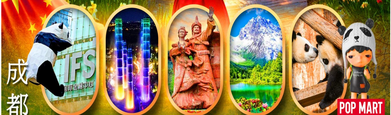
IFS หมีแพนด้าป็นตึก SKP Global Center เมืองโบราณซงพาน อุทยานปี้ผิงโกว ศูนย์อนุรักษ์หมีแพนด้า

เจิงตู ปี้ผิงโกว จิ้งจายโกว หมีแพนด้าตัวเป็นๆ