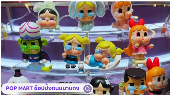
POP MART ช้อบบิงถนนนาทิง

จากนั้นอิสระท่านเฟลิตเฟลินที่ ถนนนาทิง(NANJING ROAD) เป็นย่านช้อปปิ้งเก่าแก่ที่สุดของเซี่ยงไฮ้ เป็นตลาดซื้อขายของกันคึกคักตั้งแต่ทศวรรษ 1920 ตั้งอยู่ฝั่งผู้ซีกินพื้นที่ยาวตั้งแต่ฝั่งตะวันตกของ “เดอะ บันด์” ถึง “พีเพิลส์ สแควร์” เป็นแหล่งช้อปปิ้งสินค้าแบรนด์เนมจากทั่วโลก และยังเป็นศูนย์รวมร้านค้าและร้านอาหารอีกมากมาย และพลาดไม่ได้กับนักจุ่มอาร์ททอยอย่าง แบรินด์ POPMART GLOBAL FLAGSHIP STORE ร้านขายของเล่นที่เป็นที่โด่งดังในขณะนี้ไม่ว่าจะ LABUBU MOLLY SKULLPANDA และอย่างอื่นอีกมากมาย ให้ท่านได้เลือกลุ้นกันอย่างสนุกสนาน