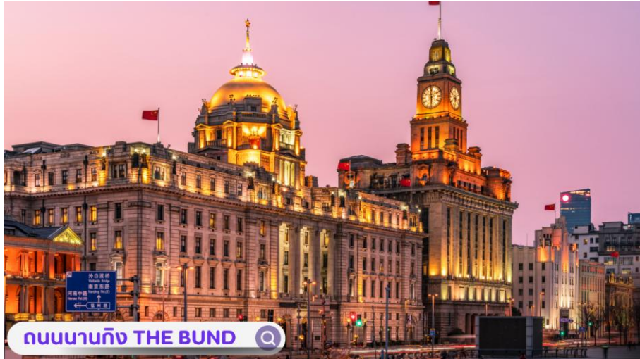
ถนนนาทิง THE BUND

จากนั้นอิสระท่านเฟลิตเฟลินที่ ถนนนาทิง(NANJING ROAD) เป็นย่านช้อปปิ้งเก่าแก่ที่สุดของเซี่ยงไฮ้ เป็นตลาดซื้อขายของกันคึกคักตั้งแต่ทศวรรษ 1920 ตั้งอยู่ฝั่งผู้ซีกินพื้นที่ยาวตั้งแต่ฝั่งตะวันตกของ “เดอะ บันด์” ถึง “พีเพิลส์ สแควร์” เป็นแหล่งช้อปปิ้งสินค้าแบรนด์เนมจากทั่วโลก และยังเป็นศูนย์รวมร้านค้าและร้านอาหารอีกมากมาย และพลาดไม่ได้กับนักจุ่มอาร์ททอยอย่าง แบรินด์ POPMART GLOBAL FLAGSHIP STORE ร้านขายของเล่นที่เป็นที่โด่งดังในขณะนี้ไม่ว่าจะ LABUBU MOLLY SKULLPANDA และอย่างอื่นอีกมากมาย ให้ท่านได้เลือกลุ้นกันอย่างสนุกสนาน