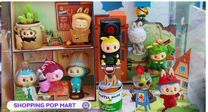
SHOPPING POP MART

ค่ำ รับประทานอาหารค่ำ ณ ภัตตาคาร (มื้อที่ 2)