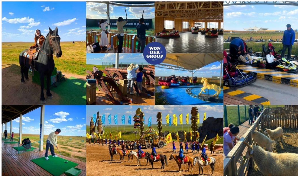
พิเศษ สวมชุดพื้นเมืองแบบมองโกล สัมผัสพลังแห่งบรมบุรุษ สวมเสื้อคลุมแบบดั้งเดิม ที่มีสีสันสดใสปกคลุมลายอันประณีต