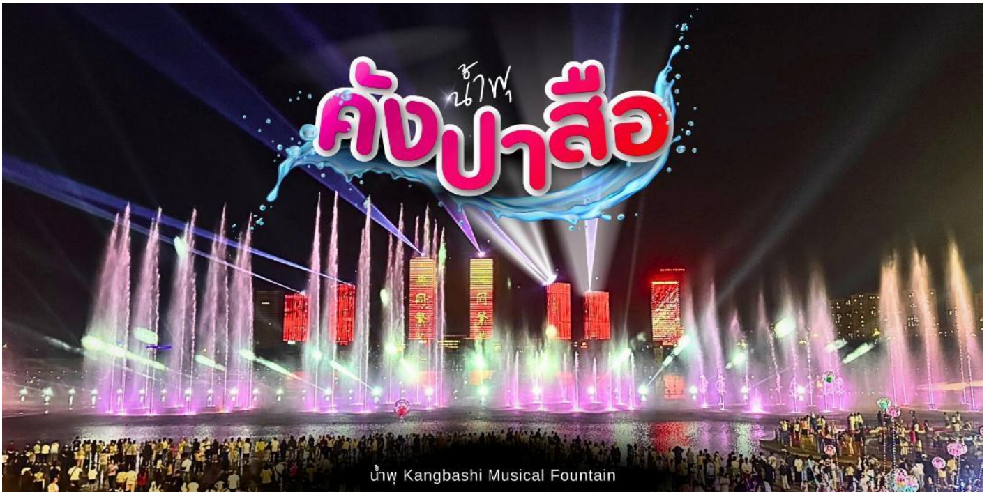
น้ำพุ Kangbashi Musical Fountain

ที่พัก HOLIDAY INN EXPRESS HOTEL หรือระดับเทียบเท่า 4 ดาว