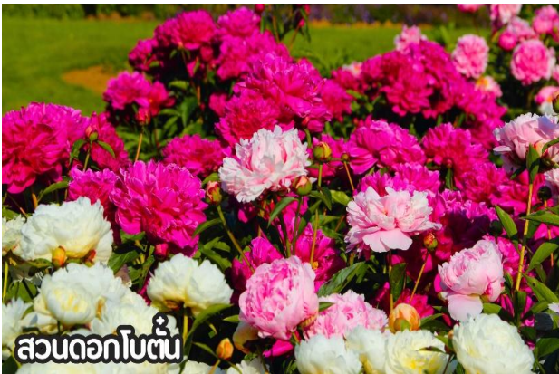
สวนดอกไม้

เดือนสิงหาคม-ต้นกันยายน ชมทุ่งดอกเบญจมาศหรือดอกไฮเดรนเยีย ดอกเบญจมาศปักกิ่งหมายถึงสายพันธุ์เบญจมาศที่มีต้นกำเนิดหรือนิยมปลูกในกรุงปักกิ่ง ประเทศจีน โดยเฉพาะช่วงฤดูใบไม้ร่วง ที่มีการจัดงานมหกรรมดอกเบญจมาศ แสดงความหลากหลายของสีสรรและรูปทรง มีสายพันธุ์เช่น "กุสุยจินเสี่ย" ที่ได้รับรางวัลราชาดอกเบญจมาศ และยังมีเบญจมาศปักกิ่งสีขาวที่เป็นสมุนไพรด้วย ที่สำคัญคือเป็นดอกไม้ที่ใช้ในงานเทศกาลและวัฒนธรรม โดยเฉพาะในสวนสาธารณะ เช่น รื่อถาน และ อุทยานเป่ย์ไห่ มีหลากหลายสี เช่น ขาว เหลือง ชมพู แดง และม่วง สามารถพบได้ในหลายพื้นที่