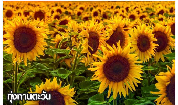
ทุ่งทานตะวัน

จากนั้นนำท่านสู่ถนนคนเดินสุดฮิตใจกลางกรุงปักกิ่ง ปัจจุบันถนนนี้เป็นที่นิยมมากในหมู่นักช้อปปิ้งและนักท่องเที่ยวที่ตบเท้าเข้ามาเพื่อเสาะหาของลดราคาและเสื้อผ้าที่มีเอกลักษณ์ไม่ซ้ำใคร ถนนการค้าที่พลุกพล่านแห่งนี้มีมีมานั่ง บาร์ ร้านอาหาร และคาเฟ่เรียงรายตลอดทางอยู่บนถนนคนเดินสายนี้ ให้ท่านได้ช้อปปิ้งร้าน Pop Mart ที่ใหญ่ที่สุดในปักกิ่งตุ๊กตา box หน้าตาน่ารักที่ดังที่สุดในจีนตอนนี้ ต้องยกให้กับ Pop Mart