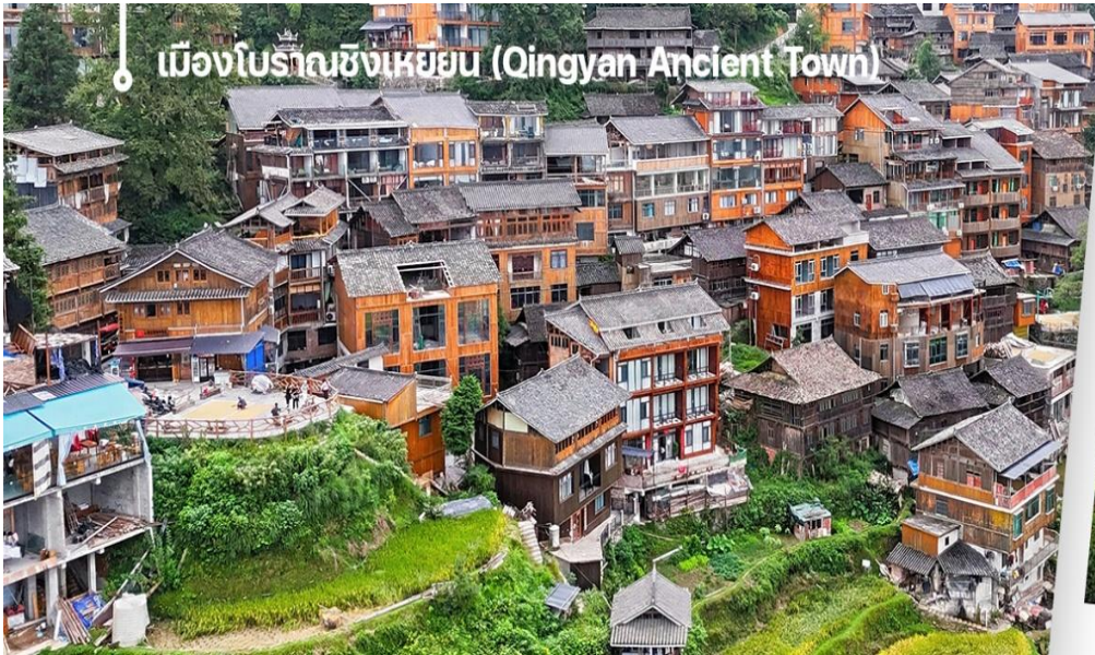
เมืองโบราณชิงเหียน (Qingyan Ancient Town)

จากนั้นนำท่านเดินทางสู่เมืองโบราณชิงเหียน (Qingyan Ancient Town) เป็นหนึ่งในสี่เมืองโบราณที่มีชื่อเสียงที่สุดในมณฑลกุ้ยโจว ประเทศจีน เมืองแห่งนี้มีประวัติศาสตร์ยาวนานกว่า 600 ปี ตั้งแต่สมัยราชวงศ์หมิง และเคยเป็นป้อมปราการทางทหาร มีเอกลักษณ์โดดเด่นจากสถาปัตยกรรมที่สร้างด้วยหินเป็นส่วนใหญ่ โดยมีอาคาร กำแพง และถนนที่ทำจากหินปูนด้านในเมือง มีบ้านเรือนของคนท้องถิ่น ซึ่งเป็นถนนสายหลักที่มีร้านค้าขายของที่ระลึก งานฝีมือ และอาหารพื้นเมือง ภายในกำแพงเมืองยังมีวัด ศาลเจ้าและโบสถ์ที่มีการผสมผสานทางสถาปัตยกรรมทั้งแบบจีนและยุโรป และบ้านจอหวาน สมัยก่อนยังคงเอกลักษณ์แบบดั้งเดิม ยังคงสวยงามสำหรับผู้มาเยือนเสมอ