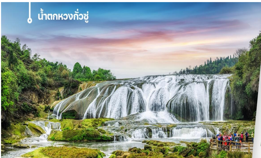
น้ำตกหวงกั๋วชู่

จากนั้นนำท่านเดินทางเมืองอันชุ่น (Anshun) เป็นเมืองระดับจังหวัดที่ตั้งอยู่ทางตะวันตก มีชื่อเสียงด้านธรรมชาติที่อุดมสมบูรณ์ โดยเฉพาะอย่างยิ่ง **น้ำตกหวงกั๋วชู่** ซึ่งเป็นน้ำตกที่ใหญ่ที่สุดแห่งหนึ่งของจีน และยังเป็นศูนย์กลางทางวัฒนธรรมและมีแหล่งท่องเที่ยวทางธรรมชาติระดับ 5A นำท่านชื่นชมความตระการตาการแสดงโชว์แสง สี เสียง ที่มีฉากหลังเป็นน้ำตกที่ใหญ่เป็นอันดับ 3 ของโลกเลยทีเดียว