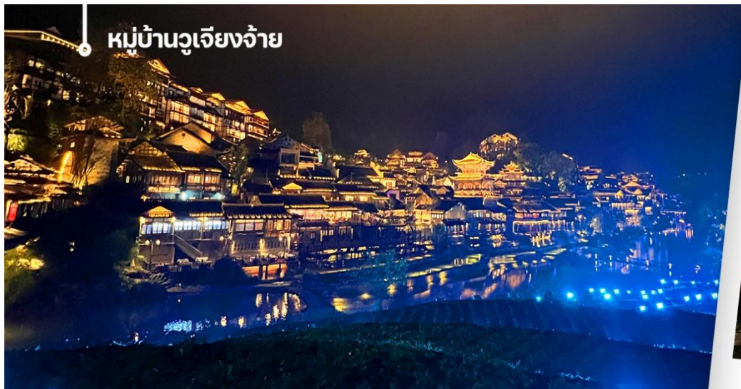
หมู่บ้านวูเจียงจ้าย

(รวมค่าล่องเรือชมวิวตอนกลางคืนอันสวยงาม)