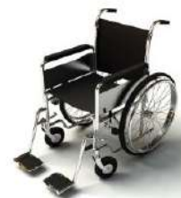
การรับดูแลเป็นพิเศษ

กรณีผู้เดินทางต้องการความช่วยเหลือเป็นพิเศษ อาทิเช่น การใช้วีลแชร์ กรุณาแจ้งบริษัทฯ อย่างน้อย 7 วันก่อนการเดินทาง มิฉะนั้นบริษัทฯ จะไม่สามารถจัดการล่วงหน้าได้ เนื่องจากการขอใช้วีลแชร์ในสนามบินนั้น ต้องมีขั้นตอนในการขอล่วงหน้า และบางสายการบินอาจมีการเรียกเก็บค่าใช้จ่ายทั้งทางสนามบินในไทยและในต่างประเทศ ซึ่งผู้เดินทางสามารถสอบถามกับเจ้าหน้าที่ได้โดยตรงก่อนทำการจอง และหากในขณะของท่านมีผู้ต้องการดูแลพิเศษ เช่น ผู้ที่นั่งรถเข็น (Wheelchair), เด็ก, ผู้สูงอายุและผู้ที่มีโรคประจำตัวหรือไม่สะดวกในการเดินทางท่องเที่ยวในระยะเวลากว่า 4 - 5 ชั่วโมงติดต่อกัน ท่านและครอบครัวต้องให้การดูแลสมาชิกภายในครอบครัวของท่านเอง เนื่องจากการเดินทางเป็นหมู่คณะ หัวหน้าทัวร์มีความจำเป็นต้องดูแลคณะทัวร์ทั้งหมด