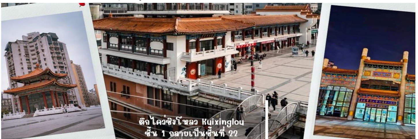
ตึก ไควชิงโหลว Kuixinglou ชั้น 1 กลายเป็นชั้นที่ 22

นำท่านเดินทางไปชมความแปลกใหม่ที่ ตึกไควชิงโหลว (ตึก 22 ชั้น) Kuixinglou ชั้น 1 กลายเป็นชั้นที่ 22 ของ อีกฝั่งอาคารเก่าแก่ฉงชิ่งมหัศจรรย์ ยังเป็นสถานที่ถ่ายทำภาพยนตร์เรื่อง "Young You" โดย Yi Yang Qianxi "Kui Xing Tower" อาคารโบราณที่ตั้งอยู่ในเมือง ที่นี่ได้รับการต่อเติมและสร้างขึ้นใหม่ในปี 1991 สิ่งมหัศจรรย์ที่สุดที่นี่ ไม่ใช่ตัวอาคาร แต่เป็นสะพานแขวนสองแห่งระหว่างจัตุรัสกับอาคารสำนักงาน สะพานแขวนที่เต็มไปด้วยลูกกลม เชื่อมระหว่างชั้น 1 ของจัตุรัสกับชั้นบนสุดของชั้น 22 ฝั่งตรงข้ามมองลงมาจากชั้น 1 จะเห็นได้ว่าด้านข้างมี 22 ชั้น เป็นอาคารที่มีลักษณะพิเศษที่เมืองฉงชิ่ง ประเทศจีน เนื่องจากภูมิประเทศที่เป็นภูเขา อาคารแห่งนี้จึงมีทางเข้าใน ระดับที่ต่างกัน เป็นจุดถ่ายรูปและชมวิวที่โดดเด่นของเมืองฉงชิ่งที่ได้ชื่อว่าเป็น "เมืองสามมิติ"