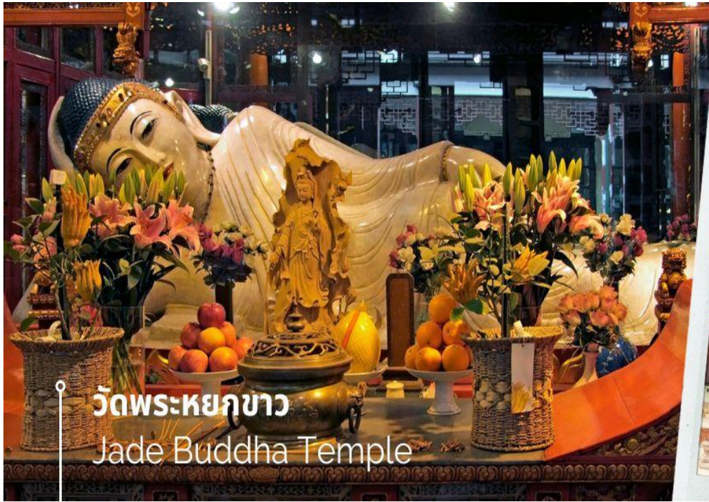
วัดพระหยกขาว Jade Buddha Temple