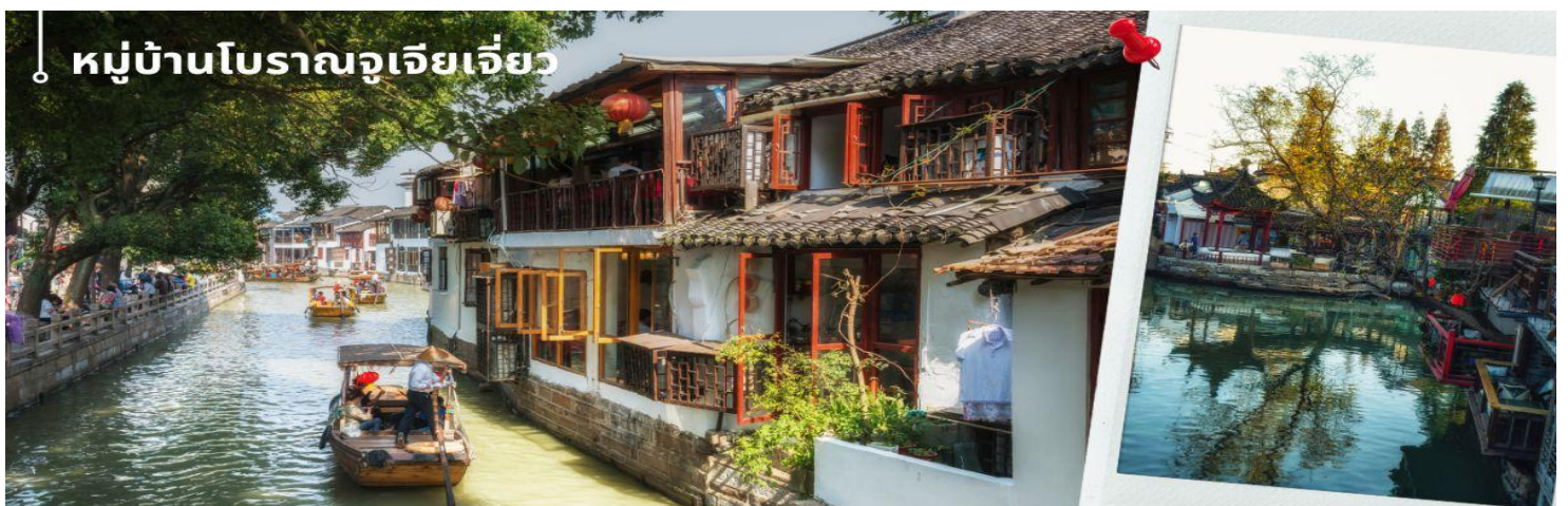
หมู่บ้านโบราณจูเจียเจี้ยว

📍รับประทานอาหารกลางวัน ณ ภัตตาคาร (4) เมนูพิเศษ ขาหมูร่ำรวย