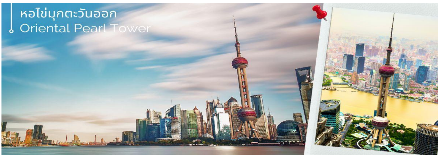
หอไข่มุกตะวันออก Oriental Pearl Tower

นำท่านเดินทางสู่แลนด์มาร์คของเมืองเซี่ยงไฮ้ที่นักท่องเที่ยวทั้งชาวจีนและชาวต่างชาติ ต่างพากันมาถ่ายรูปอย่างไม่ขาดสาย เมื่อมาถึงเมืองเซี่ยงไฮ้ นั่นคือ หอไข่มุกตะวันออก Oriental Pearl Tower (รวมบัตรขึ้นชม) เป็นหอส่งสัญญาณวิทยุโทรทัศน์สูง 468 เมตร ลักษณะเป็นไข่มุก 11 ลูก และ เสา 3 เสา ด้านบนเป็นรูปไข่มุก 3 เม็ด 3 ขนาดเรียงกันในแนวตั้ง เมื่อชมวิว ถ่ายรูปกันจนหน้าใจแล้ว นำท่านเดินทางเข้าอุโมงค์เลเซอร์ ซึ่งเป็นอุโมงค์ลอดแม่น้ำแห่งแรกในประเทศจีนโดยอุโมงค์นี้จะพาเราเดินทางข้ามจากฝั่งหอไข่มุกตะวันออก ของหาดไว่ทาน ให้ท่านเปิดประสบการณ์ใหม่กับ The Bund Sightseeing Tunnel อุโมงค์เลเซอร์ (รวมบัตร) เซี่ยงไฮ้ ถูกสร้างขึ้นเพื่อให้ใช้เป็นเส้นทางขนส่งนักท่องเที่ยวกรุ๊ปใหญ่ๆ ที่มาเที่ยวที่นครเซี่ยงไฮ้ ทางการเซี่ยงไฮ้ได้ติดตั้งระบบแสง