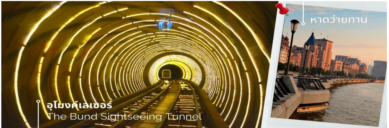
อุโมงค์เลเซอร์ The Bund Sightseeing Tunnel

นำท่านสู่บริเวณ หาดวายุทาน ตั้งอยู่บนฝั่งตะวันตกของแม่น้ำหวงผู้มีความยาวจากเหนือจรดใต้ถึง 4 กิโลเมตร เป็นเขตสถาปัตยกรรมที่ได้ชื่อว่า “พิพิธภัณฑ์สิ่งก่อสร้างหมื่นปีแห่งชาติจีน” ถือเป็นสัญลักษณ์ที่โดดเด่นของนครเซี่ยงไฮ้