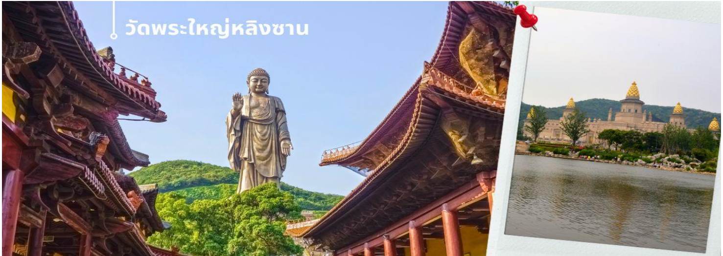
วัดพระใหญ่หลิงชาน

นำท่านชม วัดพระใหญ่หลิงชาน (นั่งรถราง) ตั้งอยู่ที่เมืองอู่ซี มณฑลเจียงซู ประเทศจีน สิ่งให้เห็นแบบเด่นชัดเมื่อมาเที่ยวที่วัดนี้คือ “หลิงชานต้าฝอ” หรือ “พระใหญ่หลิงชาน” พระพุทธรูปองค์ใหญ่ที่สุดองค์หนึ่งในประเทศจีน