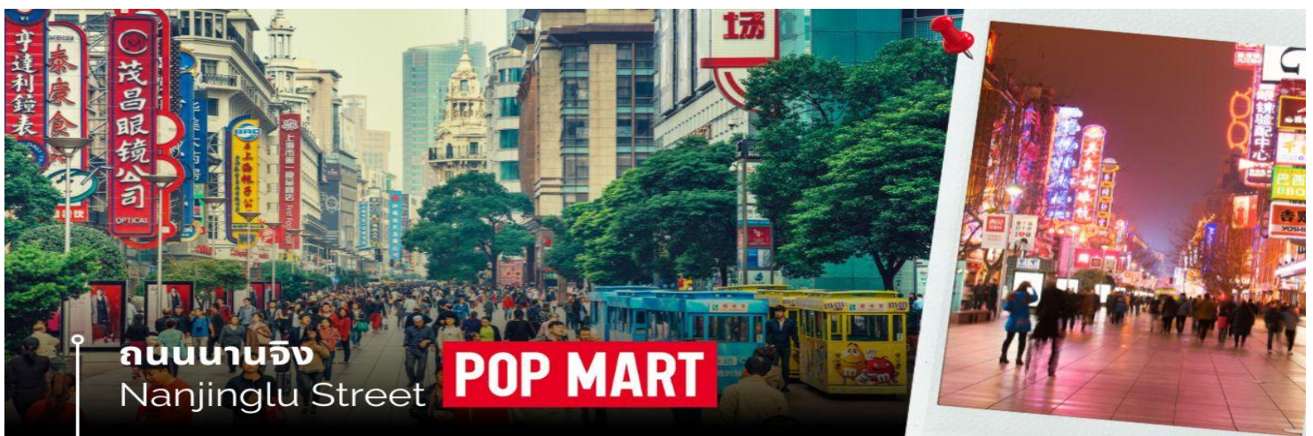
ถนนนานจิง Nanjinglu Street POP MART

📍 พักที่ Harbour Plaza Metropolitan Shanghai ระดับ 5 ดาว (หรือเทียบเท่า)