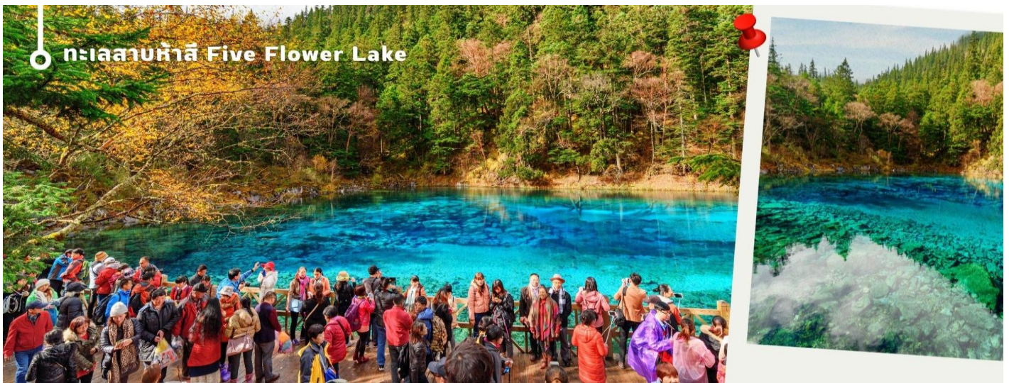
ทะเลสาบห้าสี Five Flower Lake

หนึ่งในจุดที่สวยงามและนักท่องเที่ยวแวะมาเยี่ยมชมเยอะที่สุด ตั้งอยู่ที่ความสูงเหนือระดับน้ำทะเลประมาณ 2,472 เมตร น้ำลึกประมาณ 5 เมตร น้ำใสจนเห็นพื้นด้านล่างของทะเลสาบ สีของผืนน้ำสวยงามแปลกตา โดยเฉพาะเมื่อยามแสงอาทิตย์สาดส่องกระทบผิวน้ำ สีของน้ำในทะเลสาบจะสะท้อนเป็นสีส้มถึง 5 เฉดสีสวยงามสะกดตา ซึ่งสาเหตุที่ทำให้เกิดสีส้มต่างๆ นี้มาจากการสะสมของแร่ธาตุ และพืชน้ำชนิดต่างๆ โดยจะมีสีส้มแตกต่างกันไปตามฤดูกาลและช่วงเวลา ยิ่งถ้ามาในช่วงฤดูหนาว ต้นไม้ริมทะเลสาบจะเต็มไปด้วยหิมะสีขาวตัดกับสีของทะเลสาบ ดูสวยงามแปลกตา