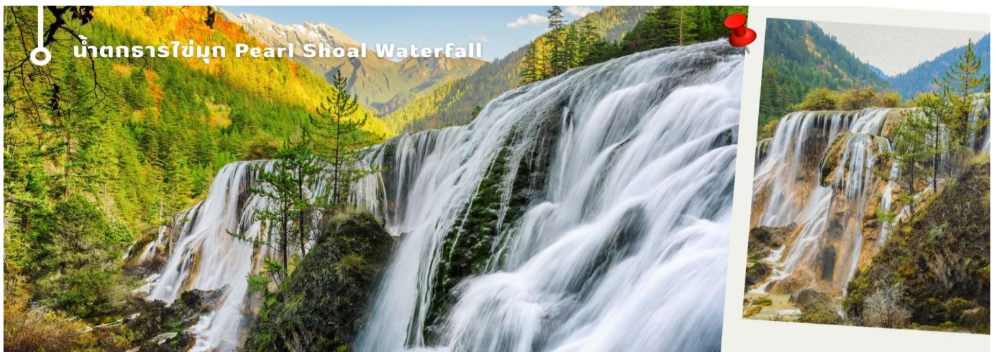
น้ำตกธารไข่มุก Pearl Shoal Waterfall

3.น้ำตกธารไข่มุก (Pearl Shoal Waterfall) หรือ น้ำตกนุริ้อหลง (Nuo Ri Lang Waterfall) ถือเป็นน้ำตกที่ใหญ่ที่สุดในจิวจ้ายโกว มีความสูง 40 เมตร กว้าง 310 เมตร เกิดจากหินปูนที่แข็งตัวจนกลายเป็นรูปทรงคล้ายพัด มีสายธารน้อยใหญ่ไหลผ่านลดหลั่นทอดยาวผ่านชั้นหินต่างๆ ยามมีแสงแดดสาดส่องตกลงกระทบผิวน้ำจะส่องประกายราวกับเส้นไข่มุกเหมือนชื่อน้ำตก บางครั้งอาจได้เห็นสายรุ้งจากแสงแดดที่สะท้อนกับละอองน้ำอีกด้วย หากได้มาในช่วงฤดูหนาว ก็จะมีหิมะเกาะตามต้นไม้ โขดหิน และถ้าอากาศหนาวมากๆ น้ำที่น้ำตกก็จะกลายเป็นน้ำแข็ง กลายเป็นประติมากรรมจากธรรมชาติที่สวยงาม