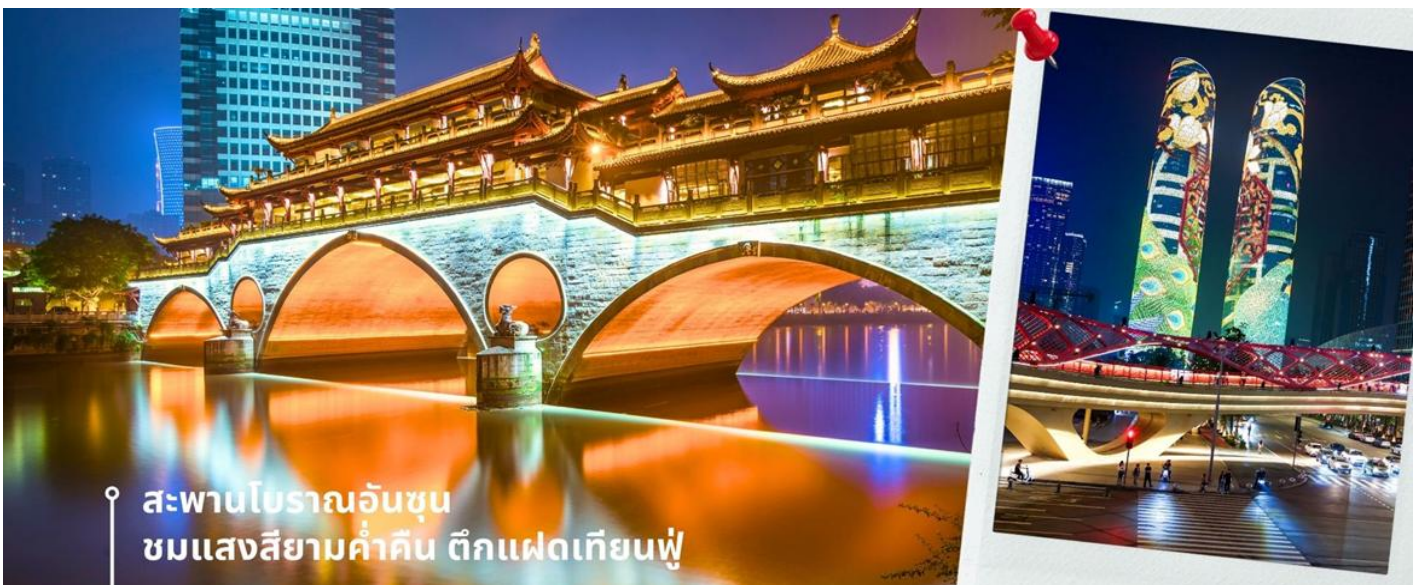
📍 สะพานโบราณอันชุน พร้อมชมแสงสียามค่ำคืน ดิกแฝดเทียนฟู่

นำท่านชม สะพานโบราณอันชุน-พร้อมชมแสงสียามค่ำคืน ดิกแฝดเทียนฟู่ เป็นสะพานข้ามคลองที่สร้างเป็นเหมือนอาคารอยู่ข้างบน ในช่วงเวลายามเย็นจะเป็นช่วงที่ผู้คนออกมาชมบรรยากาศบริเวณของสะพานแห่งนี้ และมีร้านค้ามากมาย รวมไปถึงบาร์เครื่องดื่มต่างๆ ที่ดึงดูดนักท่องเที่ยวได้เป็นอย่างดี เป็นสะพานที่ทอดข้ามแม่น้ำจินเจียง และเป็นรูปแบบสะพานมีหลังคา ตามลักษณะสถาปัตยกรรมจีนโบราณ อายุมากกว่า 300 ปี และในบริเวณใกล้เคียง ยังเป็นที่ตั้งของ ดิกแฝดเทียนฟู่ โดยในช่วงค่ำเวลา ประมาณ 19.00-22.00 น. ทั้ง 2 ดิกจะเป็นไฟ LED สวยงามโดดเด่นมาก ดิกแฝดเทียนฟู่ หรือที่เรียกอย่างเป็นทางการว่าตึกศูนย์การเงินนานาชาติเทียนฟู่ เป็นตึกระฟ้าที่สวยงามโดดเด่นสองตึกในย่านการเงินของเฉิงตู ดิกแต่ละตึกมีความสูง 58 ชั้นและสูงกว่า 700 ฟุต ดิกเหล่านี้โดดเด่นเป็นพิเศษด้วยภายนอกที่หุ้มด้วยไฟ LED ที่เป็นเอกลักษณ์ ซึ่งเปลี่ยนอาคารให้กลายเป็นจอภาพดิจิทัลขนาดใหญ่