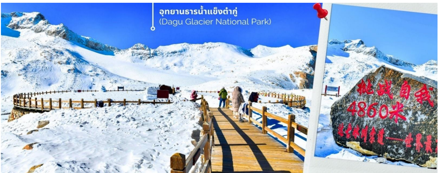
การตกและความหนาวของหิมะขึ้นอยู่กับสภาพอากาศ

จากนั้นนำท่านเดินทางสู่ เมืองเฮยสุ่ย (ใช้เวลาเดินทางประมาณ 2.5 ชั่วโมง) เพื่อเดินทางไปยัง อุทยานธารน้ำแข็งต้ากู่ปังชว่น (รวมกระเช้าขึ้นลง) ต้ากู่ปังชว่น หรือ Dagu Glacier National Park เป็นธารน้ำแข็งกลางเขี้ยวที่สวยงามที่สุดแห่งหนึ่งของโลก และเป็นสถานที่ท่องเที่ยวระดับ 4A ของจีน ตั้งอยู่ที่เมืองเฮยสุ่ย ในมณฑลเสฉวน ห่างจากเมืองเฉิงตูประมาณ 300 กิโลเมตร ถือเป็นธารน้ำแข็งที่อายุน้อยที่สุด ที่ตั้งอยู่ในระดับความสูงที่ต่ำที่สุด และอยู่ใกล้กับเมืองมากที่สุดในบรรดาธารน้ำแข็งทั้งหมด โดยอยู่สูงจากระดับน้ำทะเลประมาณ 3,800-5,100 เมตร จุดสูงสุดที่นักท่องเที่ยวสามารถขึ้นไปได้จะอยู่ที่ 4,860 เมตร