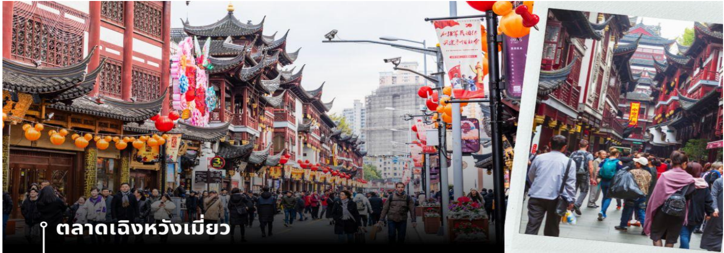
ตลาดเฉิงหวังเมี่ยว

จากนั้นนำท่านเดินทางสู่ย่าน Xin Tian Di (ซิน เทียน ตี้) ย่านฮิปเตอร์ใจกลางนครเซียงไฮ้ ที่วัยรุ่นต้องเซ็คอิน จนกลายเป็นสถานที่ท่องเที่ยวติดอันดับต้นๆไปแล้ว สำหรับแหล่งช้อปปิ้งแห่งนี้ ไม่แพ้แหล่งช้อปปิ้ง อย่าง ถนนนานกิง ถนนอุ่เจียง Yu Yuan Bazaar ถือว่าเป็นอีก 1 ไฮไลท์เด็ดของนครเซียงไฮ้ก็ว่าได้ เนื่องจากมีเอกลักษณ์ไม่เหมือนใคร สิ่งปลูกสร้างที่ใช้อิฐบุลือก สถาปัตยกรรมแบบ Shikumen (ชิกเหมิน) การผสมผสานระหว่าง