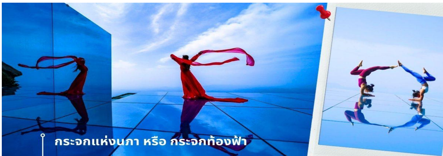
กระจกแห่งนภา หรือ กระจกทงฟ้า

จากนั้นนำท่านเดินทางสู่ อุทยานภูเขาหลงซาน (รวมกระเช้าขึ้น-ลง) ตั้งอยู่ทางตอนเหนือของประเทศจีน มณฑลชางเหรา มีพื้นที่สวยงาม 160 ตารางกิโลเมตร หลงซานถูกระบุว่าเป็น "หนึ่งใน 33 สถานที่ศักดิ์สิทธิ์ของโลก" โดยหนังสือลัทธิเต๋า เมื่ออากาศแจ่มใสและทัศนวิสัยดี คุณจะเห็นรูปปลั๊กชันที่สวยงามและตั้งตรงของภูเขาหลงซาน มีความเก่าแก่และมีมนต์ขลังมาก ไม่เพียงแต่มีภูมิทัศน์ที่สวยงาม แต่ยังมีตำนานที่ยาวนานอีกมากมาย เป็นส่วนหนึ่ง