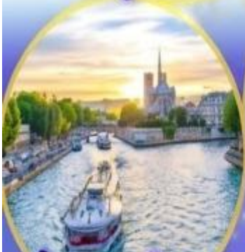
ล่องเรือแม่น้ำเซน