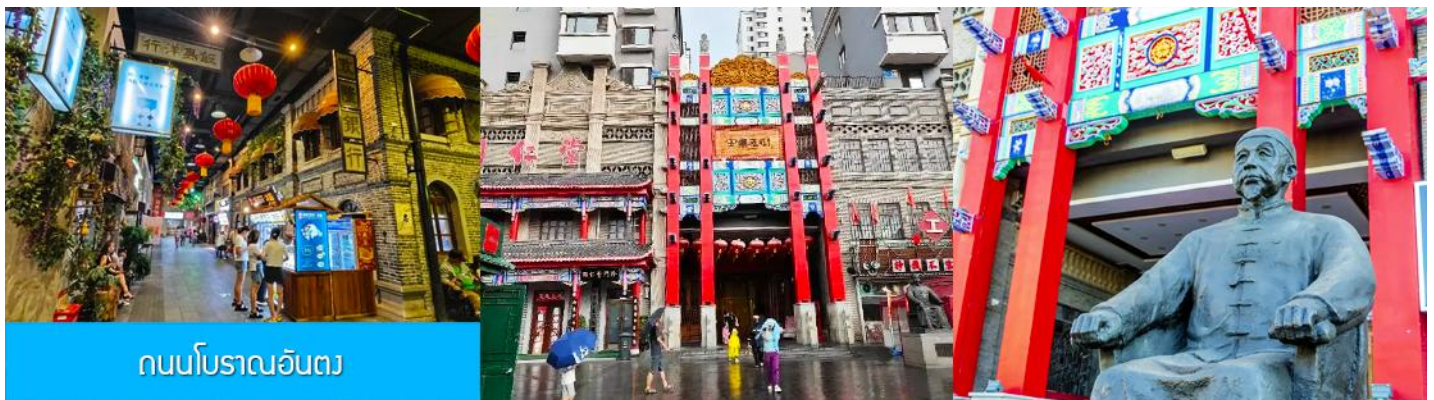
ถนนโบราณอันตง