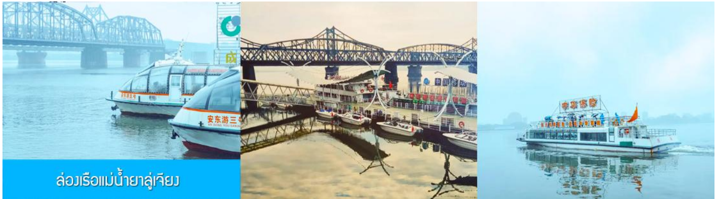
ล่องเรือแม่น้ำยาลูเจียง

หลังอาหารให้ท่านพักผ่อนตามอัธยาศัยในโรงแรม