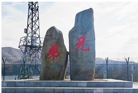
ป้ายพรมแดนจีนเกาหลีและแท่งศิลาสองพี่น้อง