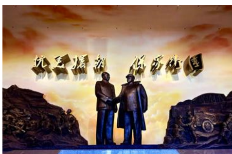
พิพิธภัณฑสถานสงครามเกาหลี

เที่ยง รับประทานอาหารกลางวัน ณ ภัตตาคาร (5)