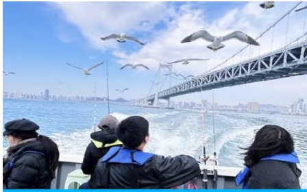
นั่งเรือใบออกทะเลเลี้ยงนกนางนวล