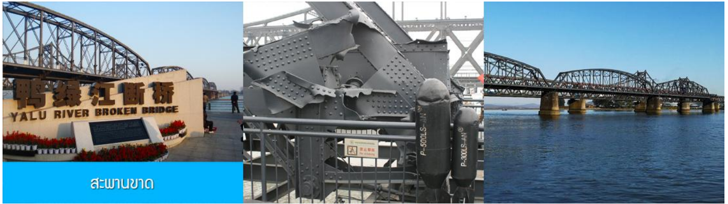
สะพานขาด