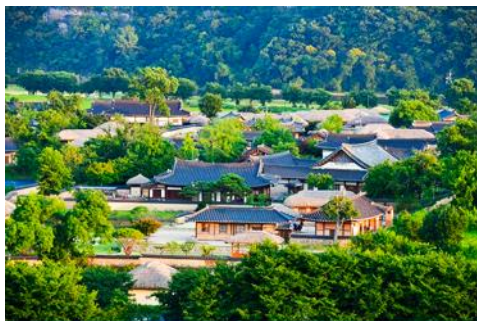
ศูนย์วัฒนธรรมเกาหลี

เช้า รับประทานอาหารเช้า ณ ห้องอาหารของโรงแรม (6)