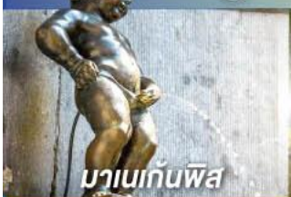
มานเนกันพิส