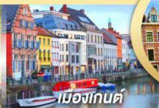
เมืองเกนต์