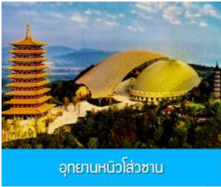
อุทยานหนิวไส่วซาน