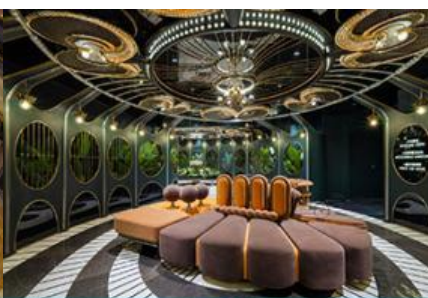
ห้องน้ำไอเทค