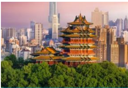
นครหนานกิง