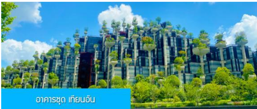
อาคารชุด เกียนอัน

เที่ยง รับประทานอาหารกลางวัน ณ ภัตตาคาร (6)