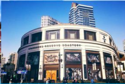
Starbuck Reserve Roastery