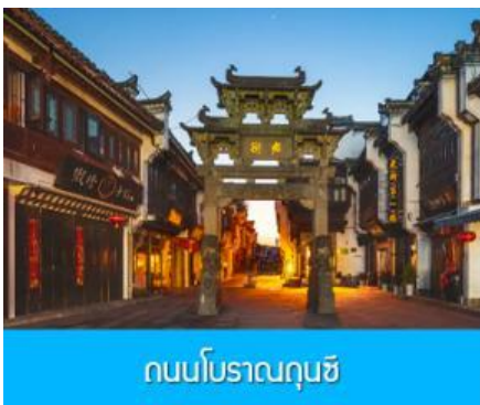
ถนนโบราณฉุนซี