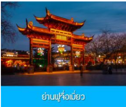
ย่านฟูจื่อเมี่ยว