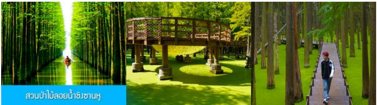
สวนป่าไม้ลอยน้ำชิงซานหู

พักที่ โรงแรม Holiday Inn Express Hotel 4* หรือเทียบเท่าในนครเซี่ยงไฮ้