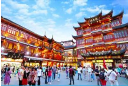
ตลาดร้อยปีฉางเหมียว