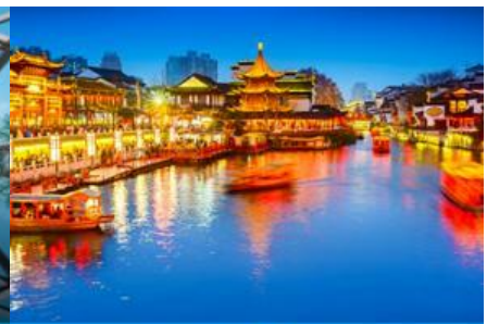
ย่านฟูจื่อเมี่ยว