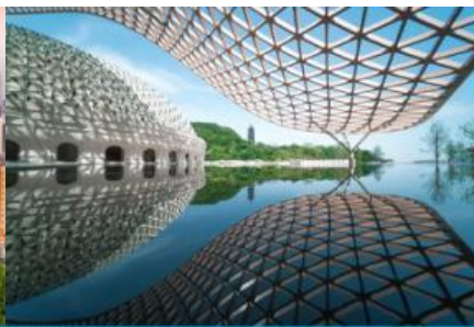
อุทยานก่อกวี่ยวหนิวโล้วซาน