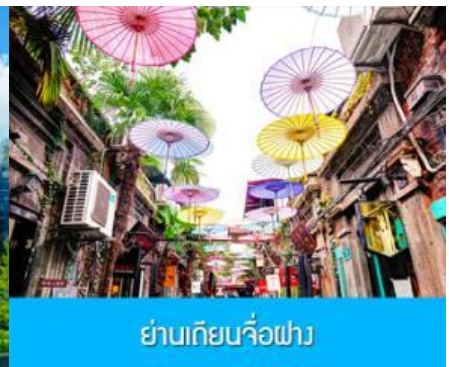
ย่านเกียนจิวผาง