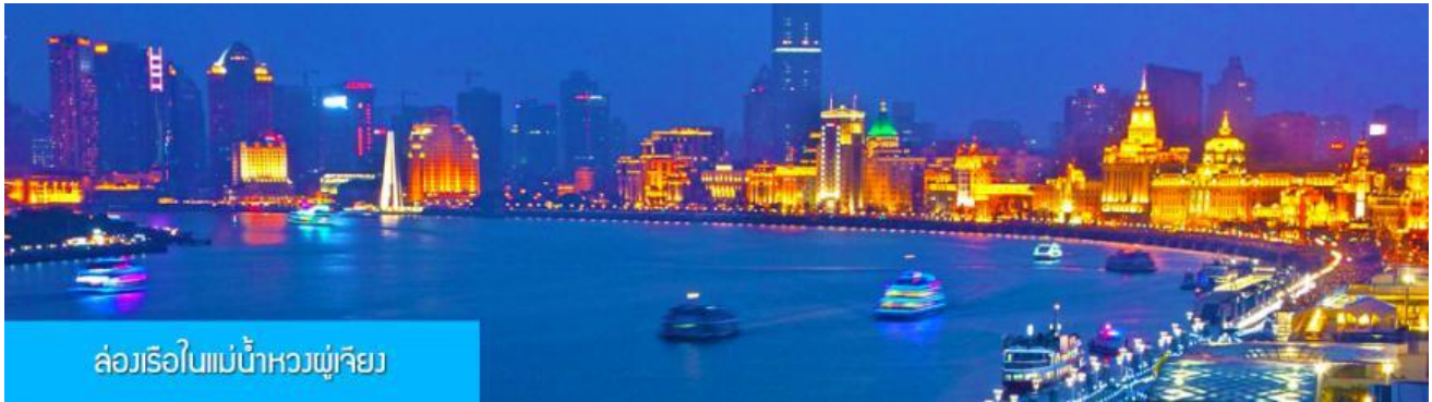
ล่องเรือใบแม่น้ำหวงผู่เจียง