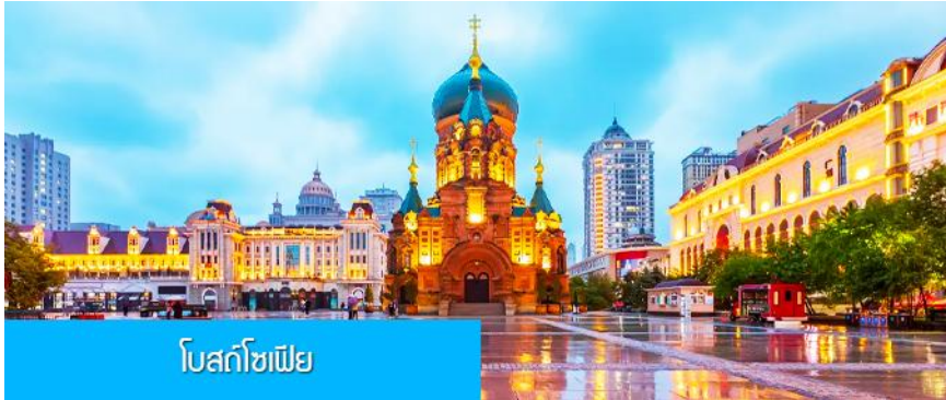
โบสถ์โซเฟีย

เช้า รับประทานอาหารเช้า ณ ห้องอาหารของโรงแรม (10)