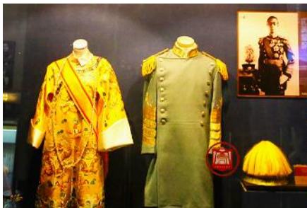
พระราชวังปูยี

เช้า รับประทานอาหารเช้า ณ ห้องอาหารของโรงแรม (7)