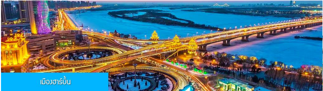
เมืองฮาร์บิน

หลังอาหารนำท่านเดินทางสู่ เมืองฮาร์บิน 哈尔滨市 (ระยะทาง 250 กม.ใช้เวลาเดินทางราว 3 ชั่วโมงเศษ) เมืองฮาร์บินเป็นเมืองที่ตั้งอยู่ทางตอนเหนือของจีนที่มีพรมแดนติดกับประเทศรัสเซีย เป็นเมืองเอกของมณฑลเฮยหลงเจียง มีสมญานามว่าเป็นกรุงมอสโกตะวันออก และได้ชื่อว่าเป็นเมืองหลวงแห่งฤดูหนาวเนื่องจากเมืองแห่งนี้มีช่วงฤดูหนาวยาวกว่าฤดูร้อน มีเทศกาลแกะสลักน้ำแข็งนานาชาติจัดขึ้นที่เมืองนี้ในช่วงฤดูหนาวของทุกปี เป็นจุดหมายปลายทางสำหรับนักท่องเที่ยวทั้งในและต่างประเทศที่ชื่นชอบความสวยงามของหิมะในฤดูหนาว