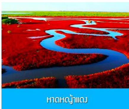
หาดหง้าแดง