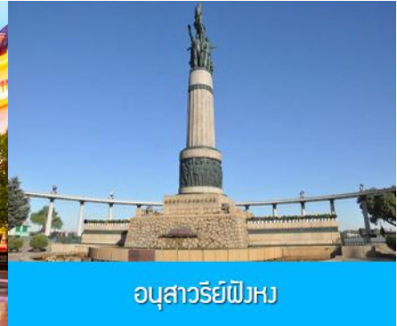
อนุสาวรีย์ฝงหวง

หลังอาหารนำท่านชม โบสถ์ เซนต์โซเฟีย 索菲亚教堂 (ชมด้านนอก) อีกหนึ่งสัญลักษณ์ที่โดดเด่นของเมืองฮาร์บิน สร้างขึ้นในปี ค.ศ. 1907 เป็นโบสถ์คริสตนิกายออร์โธดอกซ์ ที่ใหญ่ที่สุดในเอเชียตะวันออกเฉียง ที่แสดงถึงอิทธิพลของวัฒนธรรมรัสเซียที่มีต่อเมืองฮาร์บิน