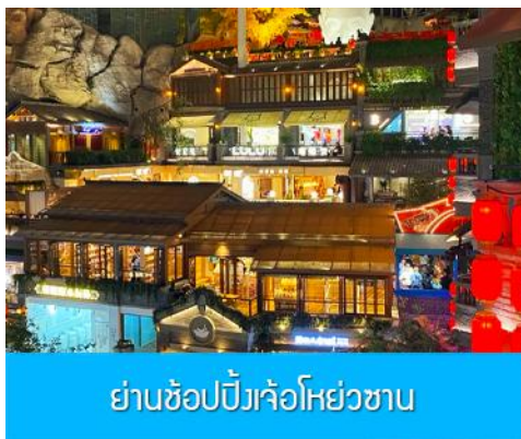
ย่านช้อปปิ้งจ้าวโฮยวชาน

หลังอาหารนำท่านเดินทางสู่เมือง ฉางชุน 长春市 (ระยะทาง 289 กม.ใช้เวลาเดินทางราว 3 ชั่วโมงเศษ)