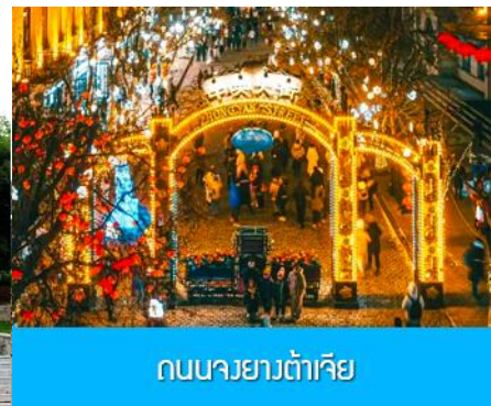
ถนนจงยังต้าเจีย