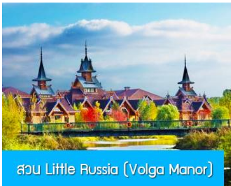
สวน Little Russia (Volga Manor)

หลังอาหารนำท่านเดินทางสู่ เมืองฮาร์บิน 哈尔滨市 (ระยะทาง 250 กม.ใช้เวลาเดินทางราว 3 ชั่วโมงเศษ) เมืองฮาร์บินเป็นเมืองที่ตั้งอยู่ทางตอนเหนือของจีนที่มีพรมแดนติดกับประเทศรัสเซีย เป็นเมืองเอกของมณฑลเฮยหลงเจียง มีสมญานามว่าเป็นกรุงมอสโกตะวันออก และได้ชื่อว่าเป็นเมืองหลวงแห่งฤดูหนาวเนื่องจากเมืองแห่งนี้มีช่วงฤดูหนาวยาวกว่าฤดูร้อน มีเทศกาลแกะสลักน้ำแข็งนานาชาติจัดขึ้นที่เมืองนี้ในช่วงฤดูหนาวของทุกปี เป็นจุดหมายปลายทางสำหรับนักท่องเที่ยวทั้งในและต่างประเทศที่ชื่นชอบความสวยงามของหิมะในฤดูหนาว