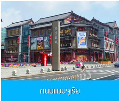
ถนนแมนจูเรีย