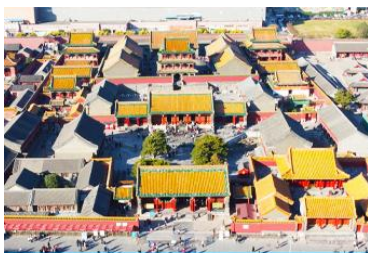
พระราชวังโบราณเสียนหยาง

เช้า รับประทานอาหารเช้า ณ ห้องอาหารของโรงแรม (4)