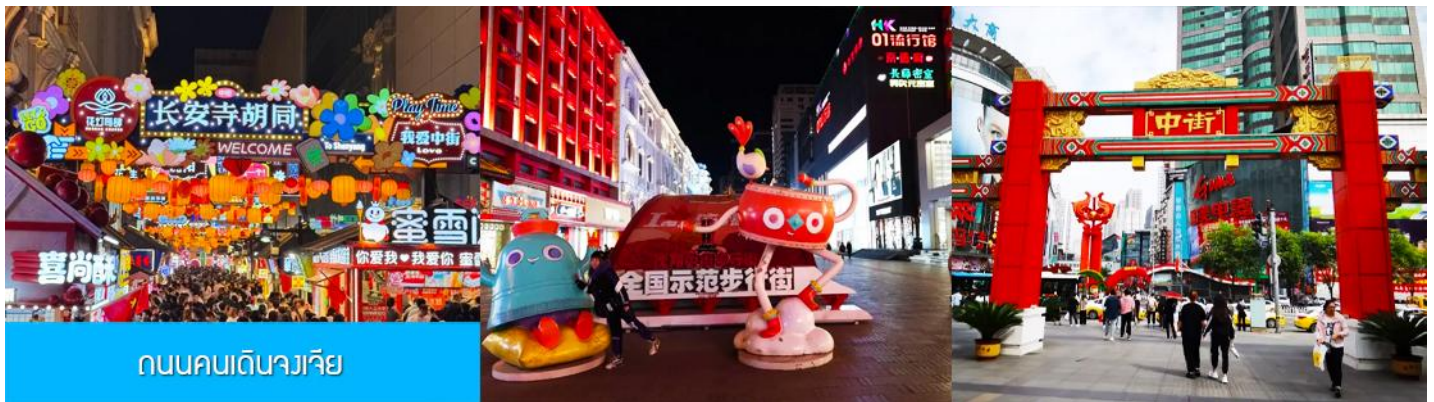
ถนนคนเดินจางเจีย

จากนั้นนำท่านเดินทางสู่ เมืองเสียนหยาง 沈阳市