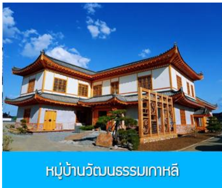
หมู่บ้านวัฒนธรรมเกาหลี

จากนั้นนำท่านเดินทางสู่ เมืองตุนฮว่า 敦化 (ระยะทาง 130 กม. ใช้เวลาเดินทางราว 2 ชั่วโมง)