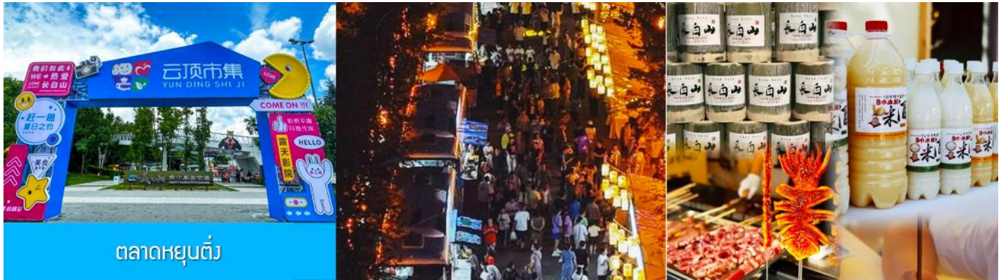
ตลาดหยุนต้ง