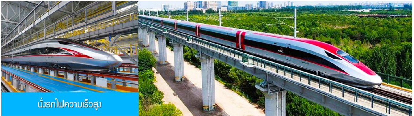
บริการรถไฟความเร็วสูง

14.05 น. นำท่านขึ้นรถไฟความเร็วสูงขบวนที่ G910 (14.05/18.46) เพื่อเดินทางไปยังกรุงปักกิ่ง 18.46 น. ขบวนรถไฟนำท่านเดินทางถึงกรุงปักกิ่ง นำท่านเดินทางโดยรถบัสภัตตาคาร เย็น รับประทานอาหารค่ำ ณ ภัตตาคาร (12) หลังอาหารนำท่านเดินทางสู่ สนามบินต้าซิง กรุงปักกิ่ง ทำการเช็คอิน โหลดสัมภาระก่อนขึ้นเครื่อง