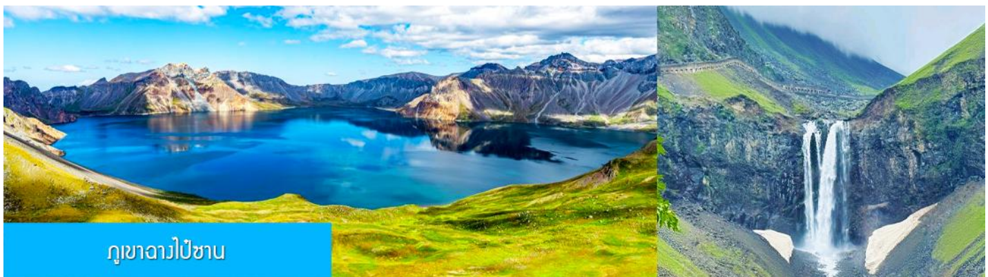
ภูเขาฉางไปซาน

หลังอาหารนำท่านเที่ยวชม ยอดเขาฉางไปซาน 长白山 (ขึ้น/ลงเนินด้านทิศเหนือ) ชมความงามที่เร้นลับของ ทะเลสาบเทียนฉือ 天池 ที่เชื่อกันว่าเป็นแหล่งน้ำศักดิ์สิทธิ์ที่อยู่ใกล้สรวงสวรรค์จนเป็นที่มาของคำว่าเทียนฉือที่แปลว่าทะเลสาบบนสวรรค์ ชม น้ำตกเขาฉางไปซาน 长白山瀑布 เป็นน้ำตกที่ไหลลงมาจากหน้าผาขนาด