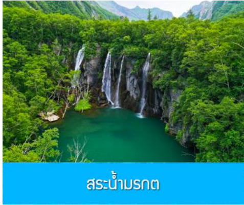
สระน้ำมรกต

ใหญ่ที่มีความสูง 68 เมตร น้ำตกแห่งนี้เป็นจุดน้ำไหลออกของทะเลสาบเทียนฉือ และเป็นต้นกำเนิดของแม่น้ำซงฮัวเจียง...ชม สระน้ำมรกต 绿渊潭 สระน้ำสีเขียวมรกตที่มีน้ำตกน้อยสองสายที่คอยเติมน้ำเข้าไปในสระ เป็น