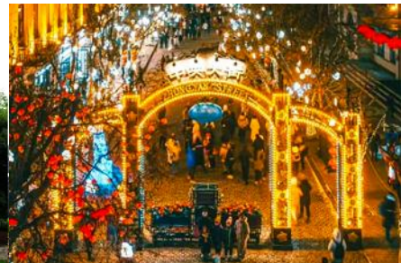
ถนนจางต้าเจีย