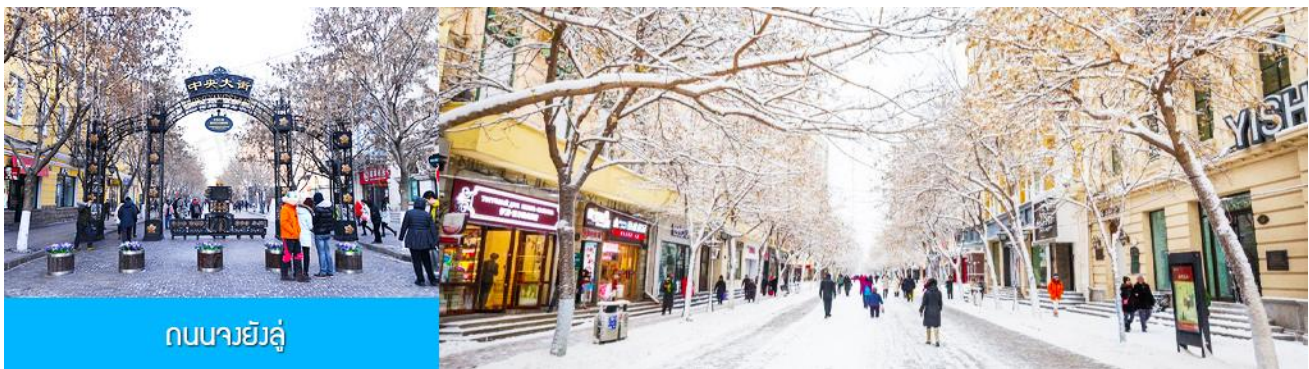
ถนนมายี่ลู่

หลังอาหารนำท่านชม อนุสาวรีย์ฝังหง 防洪纪念碑 อนุสรณ์ของชาวเมืองฮาร์บินที่ถูกจารึกในประวัติศาสตร์ ในการเอาชนะอุทกภัยธรรมชาติครั้งใหญ่ในปี ค.ศ. 1957