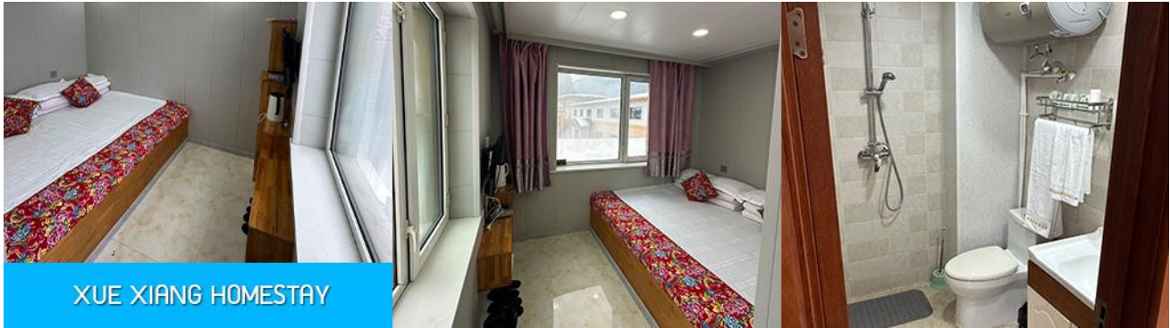
XUE XIANG HOMESTAY

ขยับแขนขาตามจังหวะดนตรี และเป็นเป็นจุดเช็คอินยอดนิยมสำหรับนักท่องเที่ยวที่มาเยือน นอกจากนี้ที่นี่ยังมีร้านขายของที่ระลึก และร้านอาหาร แผงขายผลไม้แช่แข็ง และสินค้าพื้นเมืองต่าง ๆ มากมาย..