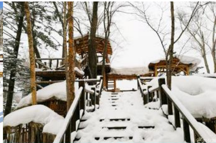
ระเบียงชมวิวบีงจขน

วันที่สาม เมืองฮาร์บิน-สถานีรถไฟยาลู-รวมนั่งม้าลากเลื่อน- หมู่บ้านหิมะ Xue xiang China Snow Town - ระเบียงชมวิว เขาบั้งจขน- ชมแสงสียามราตรีหมู่บ้านหิมะ-ชมพลุไฟและขบวนพาเหรดระบำพื้นเมือง-นอนในหมู่บ้านหิมะ Xue xiang (B/L/D)