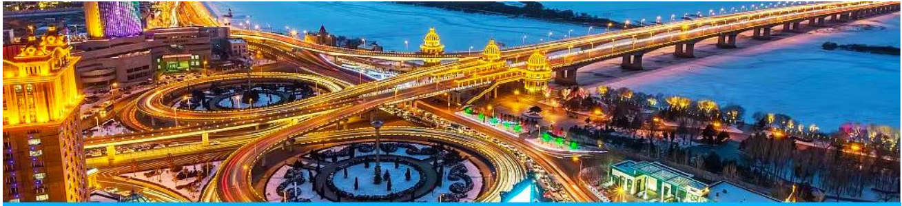
นครฮาร์บิน