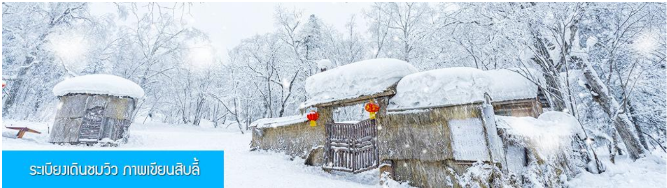
ระเบียบเดินชมวิว ภาพเขียนสลิ

ความสมัครใจ ***อิสระอาหารกลางวัน และ อาหารค่ำ เพื่อให้ท่านสะดวกในการพักผ่อนอย่างเต็มสุข