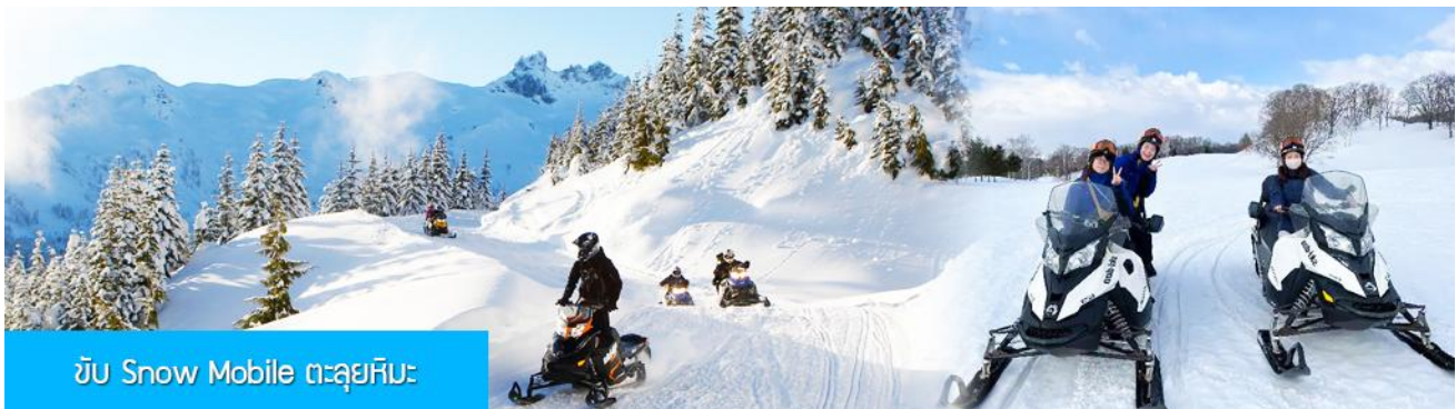
ขับ Snow Mobile ตะลุยหิมะ

รายการที่ 1 ระเบียบเดินชมวิว ภาพเขียนสลิ 冰雪十里画廊 เป็นการเดินชมวิวธรรมชาติตามเนินเขา ท่ามกลางแนวป่าที่มีต้นไม้ที่มีน้ำแข็งเกาะอยู่ตามกิ่งไม้ เป็นภาพวิวธรรมชาติดูหนาวที่สวยงามน่าประทับใจและพบได้เฉพาะในฤดูหนาวทางภาคอีสานของจีนเท่านั้น เวลาที่ใช้สำหรับโปรแกรมเสริมนี้ประมาณ 1 ชั่วโมง อัตราค่าบริการ ท่านละ 260 หยวน หรือ 1300 บาท อัตรานี้รวมค่าบัตรผ่านเข้าอุทยาน ค่ารถรับ ส่ง และค่าบริการของไกด์ท้องถิ่น และค่าบริการจัดการของบริษัททัวร์ท้องถิ่น หมายเหตุ โปรแกรมเสริมเป็นโปรแกรมที่ท่านต้องเสียค่าใช้จ่ายเองด้วยความสมัครใจ สำหรับท่านที่ไม่เข้าร่วมกิจกรรมดังกล่าวสามารถนั่งพักในรถได้