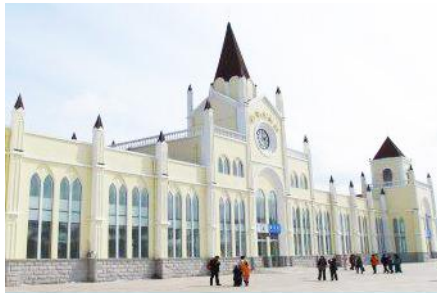
สถานีรถไฟยาลู

หมายเหตุ เพื่อความสะดวกในการเข้าพักใน HOME STAY ภายในหมู่บ้านหิมะ ทางทัวร์แนะนำให้ท่านจัดเตรียมเสื้อผ้าและเครื่องใช้เท่าที่จำเป็น 1 ชุดใส่กระเป๋าใบเล็กหรือเป้แบบสะพายได้ เพื่อสะดวกในการนำติดตัวไปใช้สำหรับคืนที่นอนในหมู่บ้านหิมะ หากนำกระเป๋าเดินทางใบใหญ่เข้าสู่ที่พักในหมู่บ้านอาจสร้างความไม่สะดวกแก่ท่าน จึงไม่แนะนำ