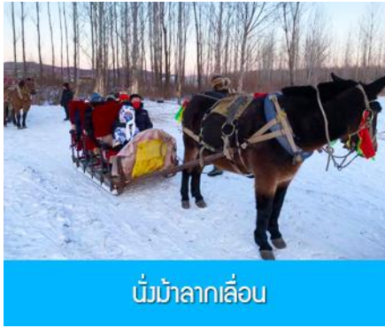
นั่งม้าลากเลื่อน