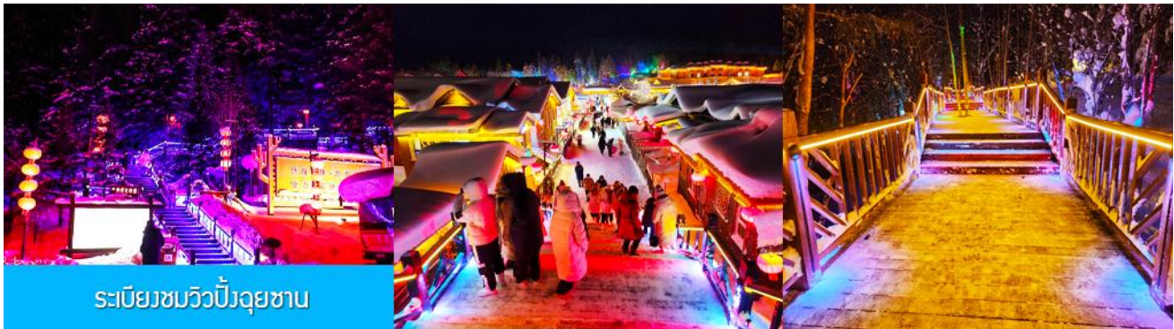
ระเบียงชมวิวยิ่งจฺยชาน

รับประทานอาหารค่ำ ณ ร้านอาหารพื้นเมืองในเมืองหิมะ (6)