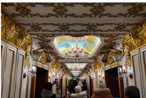
ตึกเภสัชกรรมฮาร์บิน

จากนั้นนำท่านเที่ยวชม ถนนจยงลู่ 中央大街 ถนนสายหลักของเมืองฮาร์บิน ถนนที่เต็มไปด้วยอาคาร บ้านเรือนที่เป็นสถาปัตยกรรมตะวันตกที่สร้างในช่วงคริสต์ศตวรรษที่ 18 – 19 ที่เมืองนี้ถูกปกครองโดยรัสเซีย อีกทั้งเป็นถนนคนเดินที่เป็นแหล่งรวมร้านค้าสินค้าแบรนด์เนมทั้งในและต่างประเทศ ร้านจำหน่ายของที่ระลึกและสินค้าพื้นเมือง ร้านอาหารพื้นเมืองต่าง ๆ มากมาย ให้ท่านมีเวลาอิสระเดินเที่ยวและช้อปปิ้ง หรือลิ้มรสอาหารพื้นเมืองตามอัธยาศัย.. **ให้ท่านลิ้มรสไอศกรีมชื่อดังเก่าแก่ของเมืองฮาร์บินท่านละ 1 ท่านพร