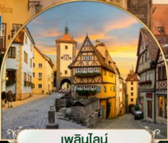
เพลินไลน์