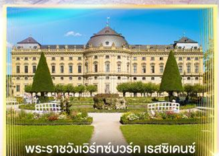
พระราชวังเวร์ทซ์บวร์ค เรสซิเดนซ์