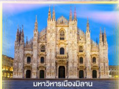
มหาวิหารเมืองมิลาน