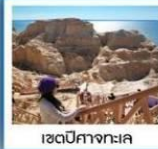
เขตปักษาสงทะเล