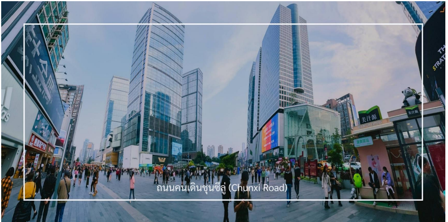
ถนนคนเดินชุนซีลู่ (Chunxi Road)

หลังอาหารเช้า นำท่านแวะชม ร้านสมุนไพรจีน แวะชมศูนย์จำหน่าย ผลิตภัณฑ์หยก แหล่งรวมเครื่องประดับและสินค้าคุณภาพ อาทิ กำไลข้อมือหยก แหวนหยก สร้อยคอหยก นำท่านช้อปปิ้ง ถนนคนเดินชุนซีลู่ (Chunxi Road) เต็มไปด้วยร้านค้าแบรนด์ชั้นนำทั้งในและต่างประเทศ รวมถึงร้านเสื้อผ้าแฟชั่น รองเท้า อุปกรณ์อิเล็กทรอนิกส์ และของฝาก ถนนคนเดินชุนซีลู่เป็นจุดที่มีความคึกคักและเต็มไปด้วยผู้คน โดยเฉพาะในช่วงวันหยุดสุดสัปดาห์และเทศกาลต่างๆ คุณจะได้พบกับการแสดงศิลปะ การแสดงดนตรี และกิจกรรมที่น่าสนใจ มีร้านอาหารมากมายที่เสนออาหารท้องถิ่นและขนมหวานที่หลากหลาย นักท่องเที่ยวสามารถลิ้มลองเมนูพื้นเมืองที่อร่อย เช่น เสี่ยวหลงเปา (ซาลาเปาเนิ่ง)