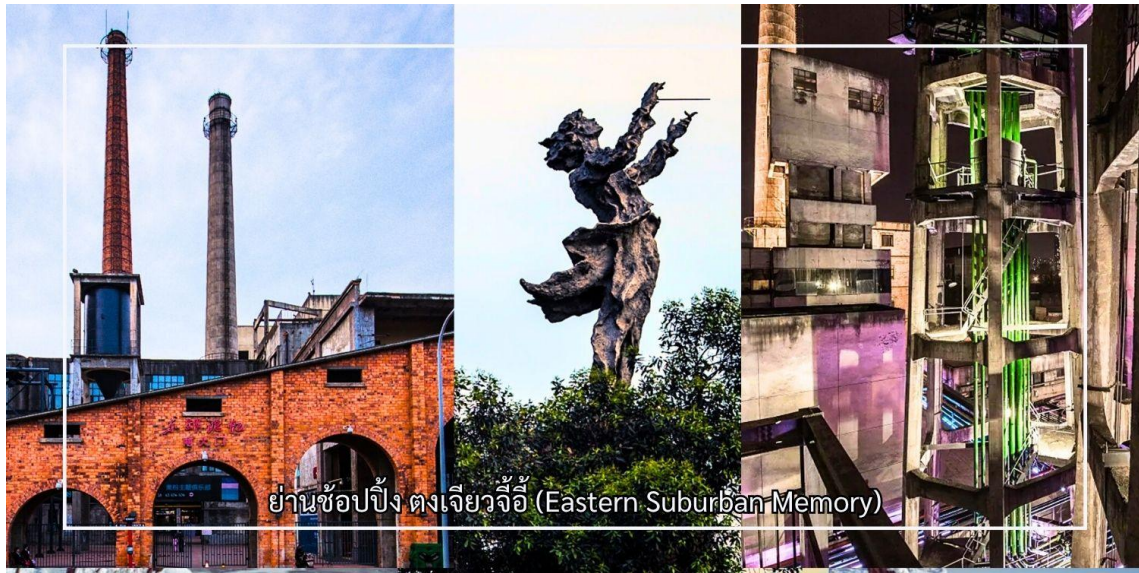
ย่านช้อปปิ้ง ตงเจียวจี้ (Eastern Suburban Memory)

นำท่านสัมผัสบรรยากาศสุดชิคที่ ถนนคนเดินฟางหวา ย่านอีสเตอร์ชื่อดังในเมืองเฉิงตู แหล่งรวมไลฟ์สไตล์ของคนรุ่นใหม่ที่ได้เต็มไปด้วยคาเฟ่สไตล์อาร์ต ร้านเสื้อผ้าวินเทจ ร้านงานดีไซน์ และร้านอาหารท้องถิ่นหลากหลายรูปแบบเหมาะสำหรับการเดินเล่น พร้อมมุมถ่ายภาพ สามารถใช้เวลาเพลิดเพลินกับการจิบกาแฟ ชิมของกินเล่น