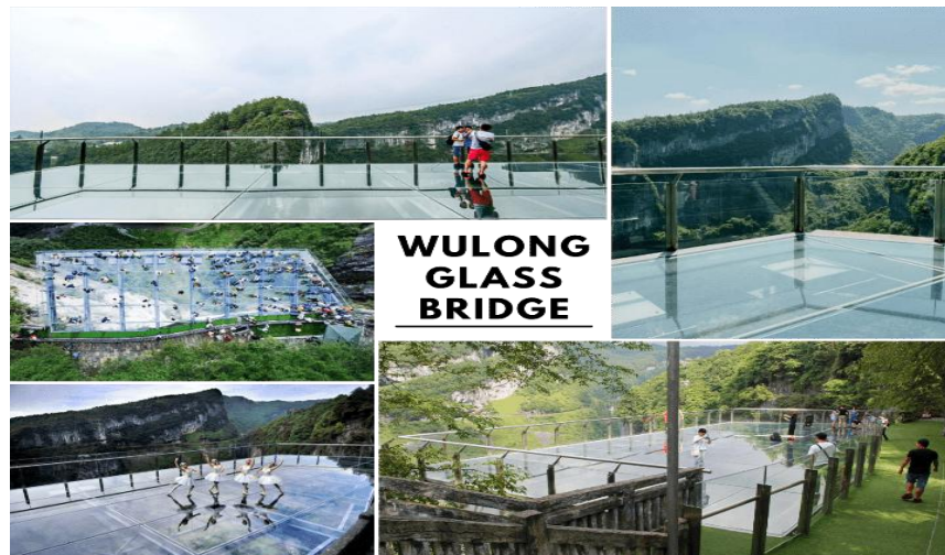
WULONG GLASS BRIDGE

จากนั้นนำท่านสู่ จุดชมวิวระเบียงแก้ว (Wulong Glass Bridge) หรือ สะพานแก้วสวรรค์ จุดชมวิวที่ใหญ่ที่สุดในเอเชีย ตั้งอยู่ 11 เมตรเหนือขอบหน้าผาสูงในเมืองเซียนหนู่ชาน กว้างอีก 26 เมตร หรือ ถ้าหากวัดจากระดับน้ำทะเลก็สูง 1,200 เมตร และจุดนี้เองที่จางอี้หมวใช้เป็นฉากในหนังการถ่ายทำหนังเรื่อง “ศึกโค่นบัลลังก์วังทอง” ล่าสุดใช้เป็นฉากในหนังฮอลลีวูดฟอร์มยักษ์ TRANSFORMER 4 ที่โด่งดังไปทั่วโลก สามารถชมวิวมุมสูงได้ทะลุถึงกันอุทยานกันเลยทีเดียว ให้ท่านชมวิว และเก็บภาพได้ตามอัธยาศัย (หมายเหตุ : กรณีที่ทางอุทยานประกาศปิด หรือ ไม้อนุญาตให้ชมวิว ณ ระเบียงกระจก ด้วยเหตุผลของอุทยานฯ ทางบริษัทขออนุญาตสงวนสิทธิ์ไม่คืนเงิน หรือ จัดรายการอื่นทดแทน เนื่องจากทางอุทยานได้รวมค่าใช้จ่ายไว้ทั้งหมดแล้ว)