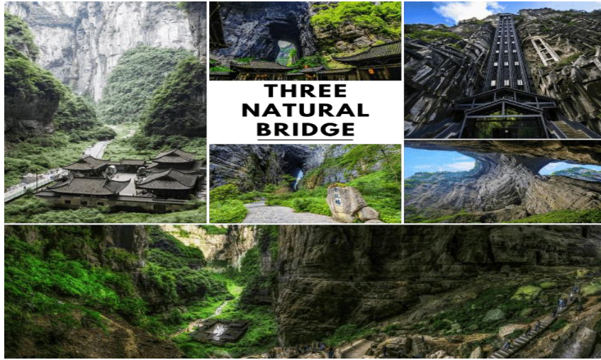
THREE NATURAL BRIDGE

จากนั้นนำท่านสู่ จุดชมวิวระเบียงแก้ว (Wulong Glass Bridge) หรือ สะพานแก้วสวรรค์ จุดชมวิวที่ใหญ่ที่สุดในเอเชีย ตั้งอยู่ 11 เมตรเหนือขอบหน้าผาสูงในเมืองเซียนหนู่ชาน กว้างอีก 26 เมตร หรือ ถ้าหากวัดจากระดับน้ำทะเลก็สูง 1,200 เมตร และจุดนี้เองที่จางอี้หมวใช้เป็นฉากในหนังการถ่ายทำหนังเรื่อง “ศึกโค่นบัลลังก์วังทอง” ล่าสุดใช้เป็นฉากในหนังฮอลลีวูดฟอร์มยักษ์ TRANSFORMER 4 ที่โด่งดังไปทั่วโลก สามารถชมวิวมุมสูงได้ทะลุถึงกันอุทยานกันเลยทีเดียว ให้ท่านชมวิว และเก็บภาพได้ตามอัธยาศัย (หมายเหตุ : กรณีที่ทางอุทยานประกาศปิด หรือ ไม้อนุญาตให้ชมวิว ณ ระเบียงกระจก ด้วยเหตุผลของอุทยานฯ ทางบริษัทขออนุญาตสงวนสิทธิ์ไม่คืนเงิน หรือ จัดรายการอื่นทดแทน เนื่องจากทางอุทยานได้รวมค่าใช้จ่ายไว้ทั้งหมดแล้ว)