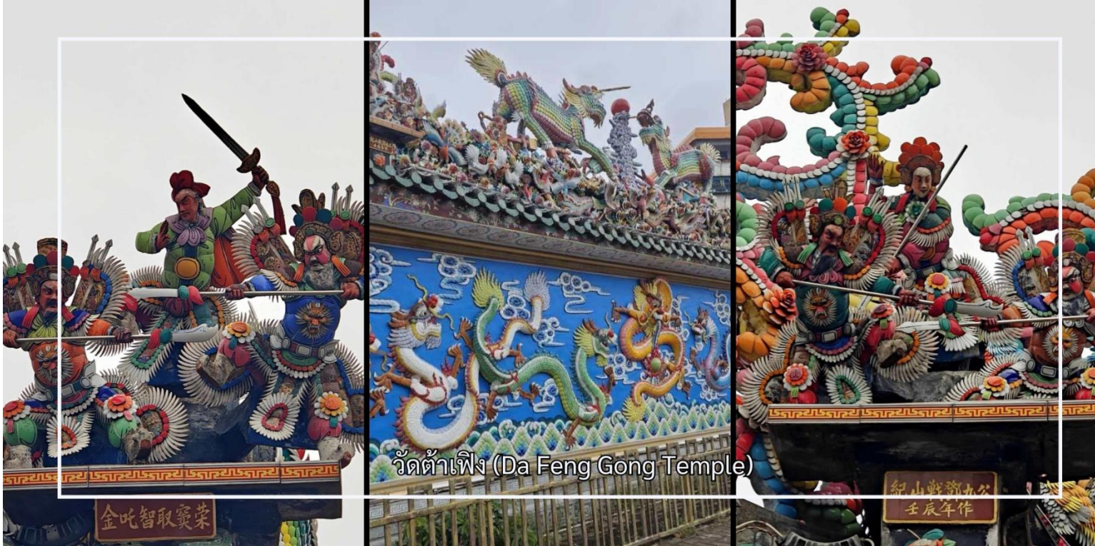
วัดต้าเฟิง (Da Feng Gong Temple)

สวนสือไถ หรือ สวนสาธารณะสือเพ้าไถ (Shitou Paotai Park) เป็นแหล่งท่องเที่ยวเชิงประวัติศาสตร์ที่ได้รับการพัฒนาอยู่บนพื้นที่ของป้อมปืนใหญ่เก่าในสมัยราชวงศ์ชิง สถานที่แห่งนี้มีบทบาทสำคัญในการป้องกันชายฝั่งและการรักษาความมั่นคงของเมืองในอดีต ภายในสวนยังคงหลงเหลือร่องรอยทางประวัติศาสตร์ เช่น โครงสร้างป้อมปราการและฐานปืนใหญ่ ผสานเข้ากับการจัดภูมิทัศน์ที่ร่มรื่นและสวยงามอย่างกลมกลืน ผู้มาเยือนสามารถเพลิดเพลินกับบรรยากาศการพักผ่อน พร้อมเรียนรู้เรื่องราวทางประวัติศาสตร์และการพัฒนาของเมืองซัวเถา