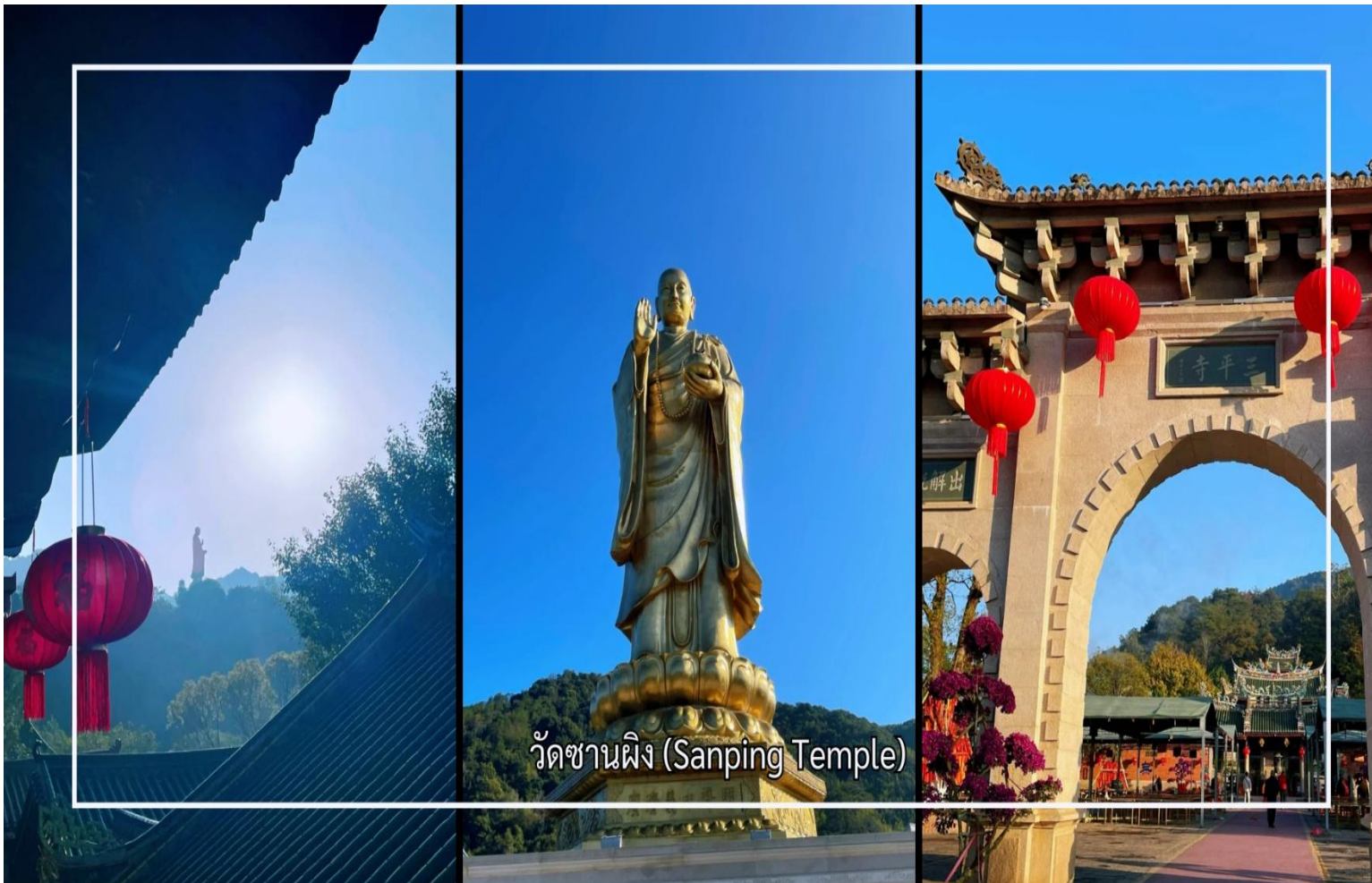
วัดซานผิง (Sanping Temple)

หลังอาหารเช้านำท่านเดินทางสู่ เมืองจิ่งโจว (Zhangzhou) เมืองสำคัญทางประวัติศาสตร์และวัฒนธรรม เมืองแห่งนี้มีประวัติความเป็นมายาวนาน และมีบทบาทสำคัญในฐานะศูนย์กลางการค้า การคมนาคม และการแลกเปลี่ยนวัฒนธรรม นำท่านสู่ วัดซานผิง (Sanping Temple) เมืองจิ่งโจว วัดพุทธที่มีความสำคัญทางประวัติศาสตร์และเป็นที่เคารพนับถืออย่างสูงของพุทธศาสนิกชน วัดแห่งนี้มีชื่อเสียงในฐานะศูนย์รวมแห่งศรัทธาและเป็นสถานที่ปฏิบัติธรรมที่สืบทอดมาอย่างยาวนาน วัดซานผิงโดดเด่นด้วยบรรยากาศอันสงบ ร่มรื่น รายล้อมด้วยธรรมชาติและสถาปัตยกรรมจีนดั้งเดิมอันงดงามผู้มาเยือนสามารถสักการะสิ่งศักดิ์สิทธิ์ เรียนรู้ประวัติความเป็นมาของวัด และสัมผัสถึงความสงบทางจิตใจ