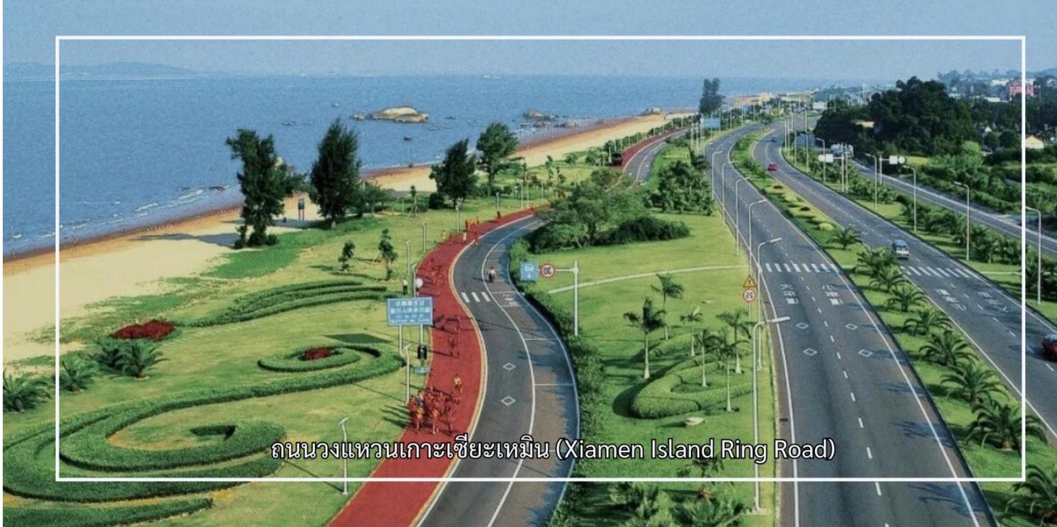
ถนนวงแหวนเกาะเซี่ยเหมิน (Xiamen Island Ring Road)

จากนั้นนำท่านอิสระช้อปปิ้ง ถนนคนเดินจงซาน (Zhongshan Road Walking Street) เป็นถนนสายการค้าที่มีชื่อเสียงและคึกคักที่สุดแห่งหนึ่งของเมืองเซี่ยเหมิน ถนนสายนี้เต็มไปด้วยร้านค้า ร้านอาหาร คาเฟ่ และแหล่งช้อปปิ้งหลากหลายรูปแบบ พร้อมสถาปัตยกรรมสไตล์จีนผสมตะวันตกที่เป็นเอกลักษณ์ สะท้อนถึงประวัติศาสตร์และความเจริญของเมืองในอดีต ท่านสามารถ เพลิดเพลินกับการเลือกซื้อสินค้า ลิ้มลองอาหารท้องถิ่นขึ้นชื่อ และเดินชมบรรยากาศย่านการค้าเก่าแก่ที่มีชีวิตชีวา ถนนคนเดินจงซานจึงเป็นจุดหมายสำคัญที่ผสมผสานทั้งการช้อปปิ้ง วัฒนธรรม และวิถีชีวิตของชาวเซี่ยเหมินไว้ได้อย่างลงตัว