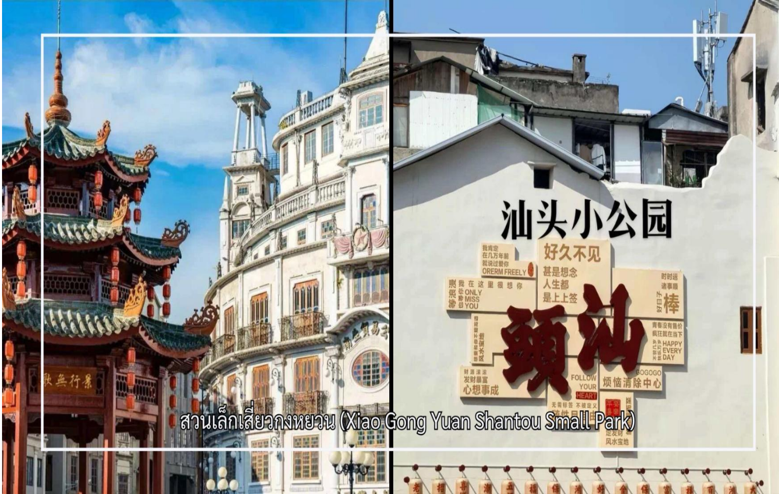
สวนเล็กเสี้ยววงหยวน (Xiao Gong Yuan Shantou Small Park)

จากนั้นนำท่านสักการะ พระราชวังแม่เต๋า หรือที่ชาวบ้านและนักเดินทางรู้จักกันในนาม ศาลเจ้าแม่ทับทิมไหตังมา (Hai Tan Ma Temple) เป็นศาสนสถานสำคัญที่สะท้อนถึงความศรัทธาอันยาวนานของชุมชนชาวจีนโพ้นทะเล ศาลเจ้าแห่งนี้อุทิศแด่เจ้าแม่ทับทิม เทพีผู้คุ้มครองการเดินทาง เรือ การค้า และความปลอดภัยในการเดินทาง โดยเฉพาะในหมู่พ่อค้าและชาวประมง ด้วยสถาปัตยกรรมจีนดั้งเดิมอันงดงาม รายละเอียดการตกแต่งที่ประณีต และบรรยากาศอันสงบศักดิ์สิทธิ์ วัดต้าเฟิง (Da Feng Gong Temple) ศาสนสถานศักดิ์สิทธิ์และเป็นที่เคารพนับถืออย่างสูงของชาวเมืองและผู้มีจิตศรัทธา วัดแห่งนี้มีความสำคัญทางประวัติศาสตร์และวัฒนธรรมมาอย่างยาวนาน ภายในวัดประดิษฐานสิ่งศักดิ์สิทธิ์ที่ผู้คนให้ความเคารพนับถือ พร้อมด้วยสถาปัตยกรรมจีนดั้งเดิมที่งดงาม