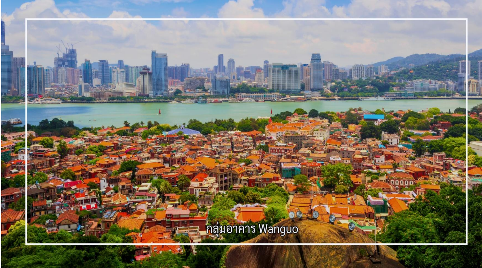
กลุ่มอาคาร Wanguo

ค่า รับประทานอาหารค่ำ ณ ภัตตาคาร (มื้อที่ 10) เดินทางเข้าสู่โรงแรมที่พัก Xiamen Liyi Hotel ระดับ 4 ดาวหรือเทียบเท่า