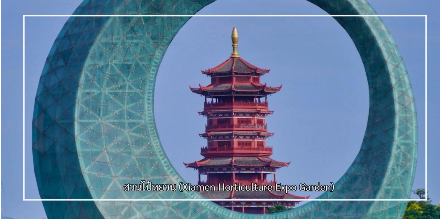
สวนโป๋หยวน (Xiamen Horticulture Expo Garden)

จากนั้นชม หอชมวิวไข่มุกทะเล (Sea Pearl Observation Tower) เป็นจุดชมวิวที่โดดเด่นและเป็นสัญลักษณ์สำคัญของเมือง ด้วยความสูงประมาณ 195 เมตร หอชมวิวแห่งนี้เปิดมุมมองทัศนียภาพแบบ 360 องศา ให้ผู้มาเยือนได้ชมความงดงามของเมืองเซียะเหมิน ชายฝั่งทะเล และภูมิทัศน์โดยรอบอย่างเต็มตา และเก็บภาพความประทับใจของเมืองท่าที่มีเสน่ห์แห่งนี้ จากนั้นเพลิดเพลินกับประสบการณ์ความบันเทิงที่ โรงภาพยนตร์โกลบอล ซึ่งนำเสนอภาพยนตร์และสื่อมัลติมีเดียทันสมัย ถ่ายทอดเรื่องราวและวัฒนธรรมของเมืองในรูปแบบที่น่าสนใจ ช่วยเติมเต็มการท่องเที่ยวให้ทั้งได้ชมวิว พักผ่อน และเรียนรู้ไปพร้อมกัน