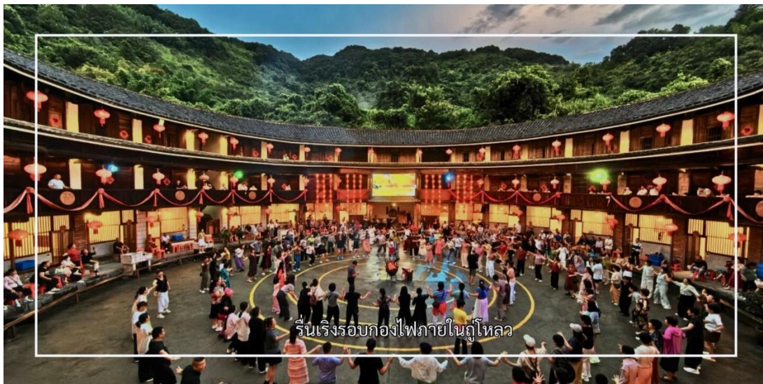
รีนเรจรอบกองไฟภายในภูโหลว

ท่านชม กลุ่มบ้านดินหมู่บ้านหนานเจียง เป็นหนึ่งในกลุ่มภูโหลวของชาวฮากกาที่มีชื่อเสียงและทรงคุณค่าทางประวัติศาสตร์ ได้รับการยกย่องว่าเป็นตัวอย่างอันโดดเด่นของสถาปัตยกรรมพื้นบ้านจีน และเป็นส่วนหนึ่งของมรดกโลกทางวัฒนธรรม กลุ่มบ้านดินหนานเจียงประกอบด้วยภูโหลวขนาดใหญ่หลายหลัง ทั้งทรงกลมและทรงสี่เหลี่ยม สร้างขึ้นจากดินอัด ไม้ และหิน โครงสร้างแข็งแรงมั่นคง สามารถรองรับการอยู่อาศัยของคนจำนวนมากภายในอาคารเดียว ภายในจัดสรรพื้นที่อยู่อาศัย ลานกลาง และพื้นที่สาธารณะอย่างเป็นระเบียบ จากนั้นเชิญท่านร่วมกิจกรรมสันทนาการ รีนเรจรอบกองไฟภายในภูโหลว สัมผัสบรรยากาศยามค่ำคืนของชุมชนพื้นถิ่น เพลิดเพลินกับการแสดงพื้นบ้าน ดนตรี และการมีส่วนร่วมในกิจกรรมตามวิถีชีวิตดั้งเดิม สร้างความประทับใจและความทรงจำอันอบอุ่นระหว่างการเดินทาง