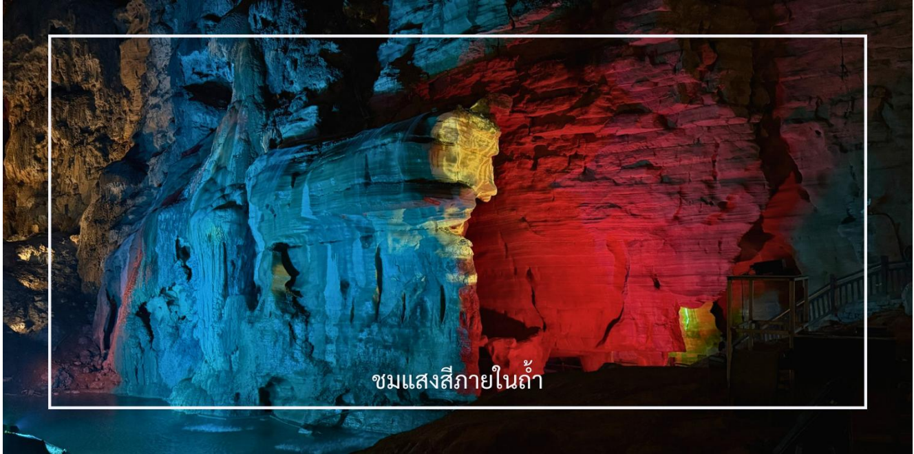
ชมแสงสีภายในถ้ำ