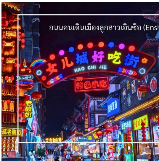
ถนนคนเดินเมืองลูกสาวเินซือ (Enshi Daughter City Pedestrian Street)

ที่นี่เรียกอีกชื่อว่า ถนนคนเดินเมืองลูกสาวเินซือ เป็นศูนย์กลางกิจกรรมท้องถิ่นที่เต็มไปด้วยสีสันและวัฒนธรรมของเินซือ ถนนเส้นนี้เต็มไปด้วยร้านค้า ร้านอาหาร และแผงขายสินค้าพื้นเมือง ทั้งของฝาก งานหัตถกรรม และอาหารท้องถิ่น ทำให้นักท่องเที่ยวได้สัมผัสวิถีชีวิตของคนท้องถิ่นอย่างใกล้ชิด บรรยากาศในยามค่ำคืนมีชีวิตชีวา แสงไฟประดับถนนสวยงามตัดกับภูมิทัศน์เมืองเก่า และมีมุมถ่ายภาพสวยๆ ให้ผู้มาเยือนได้เก็บความประทับใจ