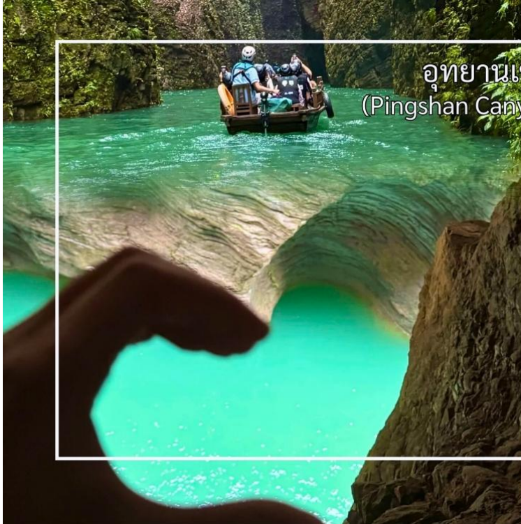
อุทยานเขาผิงซาน (Pingshan Canyon Scenic Area)