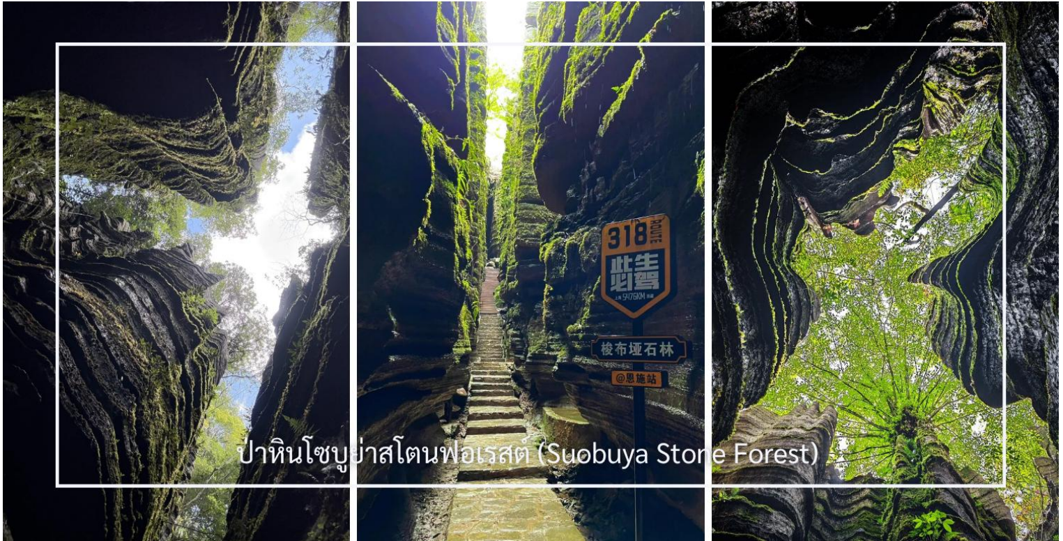
ป่าหินโซบูย่าสโตนฟอเรสต์ (Suobuya Stone Forest)