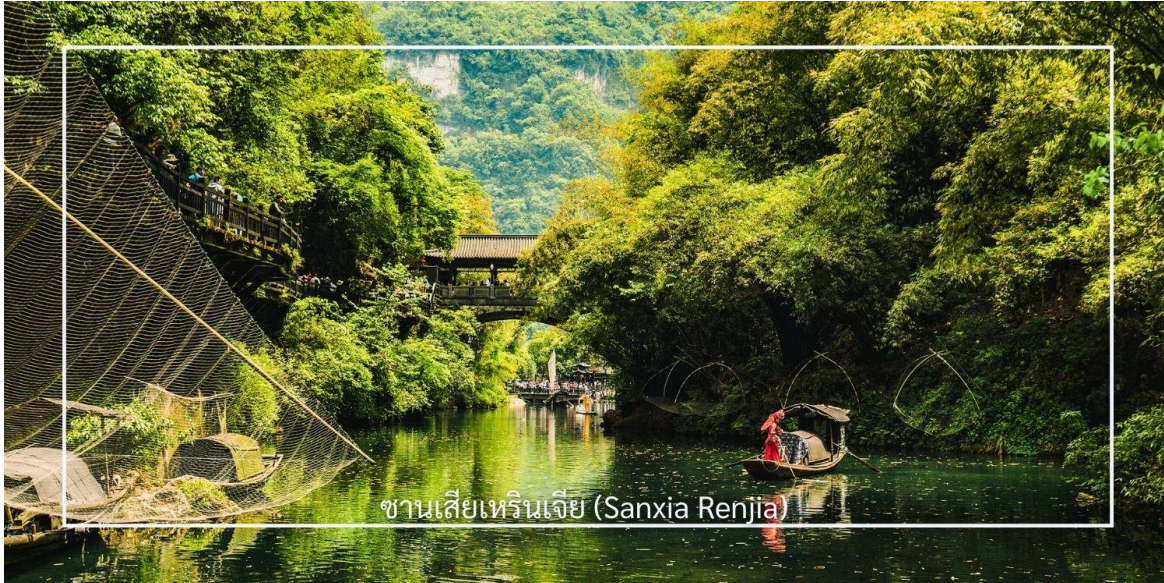
ซานเสี่ยเหรินเจีย (Sanxia Renjia)

แม่น้ำแยงซีเกียง ผ่านสถาปัตยกรรมพื้นบ้าน วัฒนธรรม ประเพณี ที่ยังคงเอกลักษณ์ไว้อย่างครบถ้วน พร้อมให้ท่านได้ชมการแสดงเรื่องราวเกี่ยวกับวิถีชีวิตควบคู่กับสายน้ำ