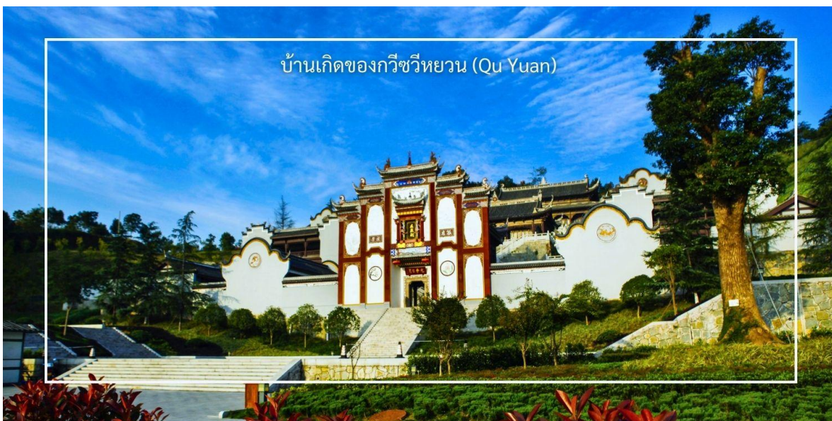
บ้านเกิดของกวีชวีหยวน (Qu Yuan)

สมควรแก่เวลานำท่านเดินทางสู่ เมืองเอนซือ (ใช้เวลาประมาณ 3.30 ชั่วโมง)