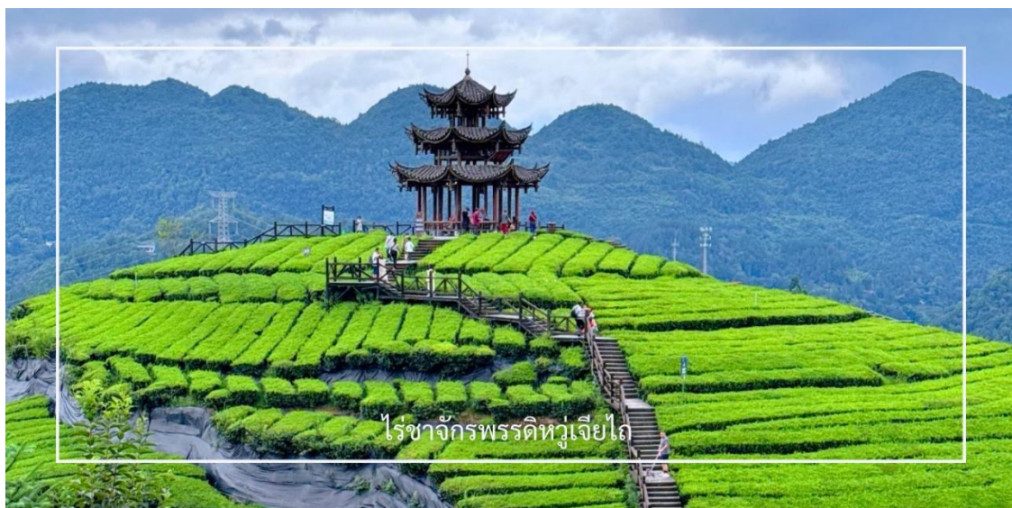
ไร่ชาจักรพรรดิหู่เจียไถ

จากนั้นนำท่านสู่ ไร่ชาจักรพรรดิหู่เจียไถ แหล่งกำเนิดชาชั้นเลิศที่สืบทอดภูมิปัญญาการเพาะปลูกและการผลิตมานานร้อยปี ไร่ชาแห่งนี้ได้รับการขนานนามว่า “จักรพรรดิ” ไม่เพียงเพราะคุณภาพของใบชาที่คัดสรรอย่างพิถีพิถัน แต่ยังสะท้อนถึงความสำคัญในอดีตที่เคยเป็นชาที่ถวายแก่ราชสำนัก ภูมิประเทศที่อุดมสมบูรณ์ อากาศเย็นสบาย และหมอกบางที่ปกคลุมตลอดปี ล้วนเป็นปัจจัยสำคัญที่ทำให้ชาจากที่นี่มีกลิ่นหอมละมุนและรสชาติกลมกล่อมเป็นเอกลักษณ์ ให้ท่านได้สัมผัสขั้นตอนการเก็บใบชาแบบดั้งเดิม เรียนรู้กระบวนการแปรรูป ไปจนถึงการชิมชาคุณภาพสูง พร้อมดื่มด่ำกับทัศนียภาพของไร่ชาที่เรียงรายตามไหล่เขาอย่างสวยงาม