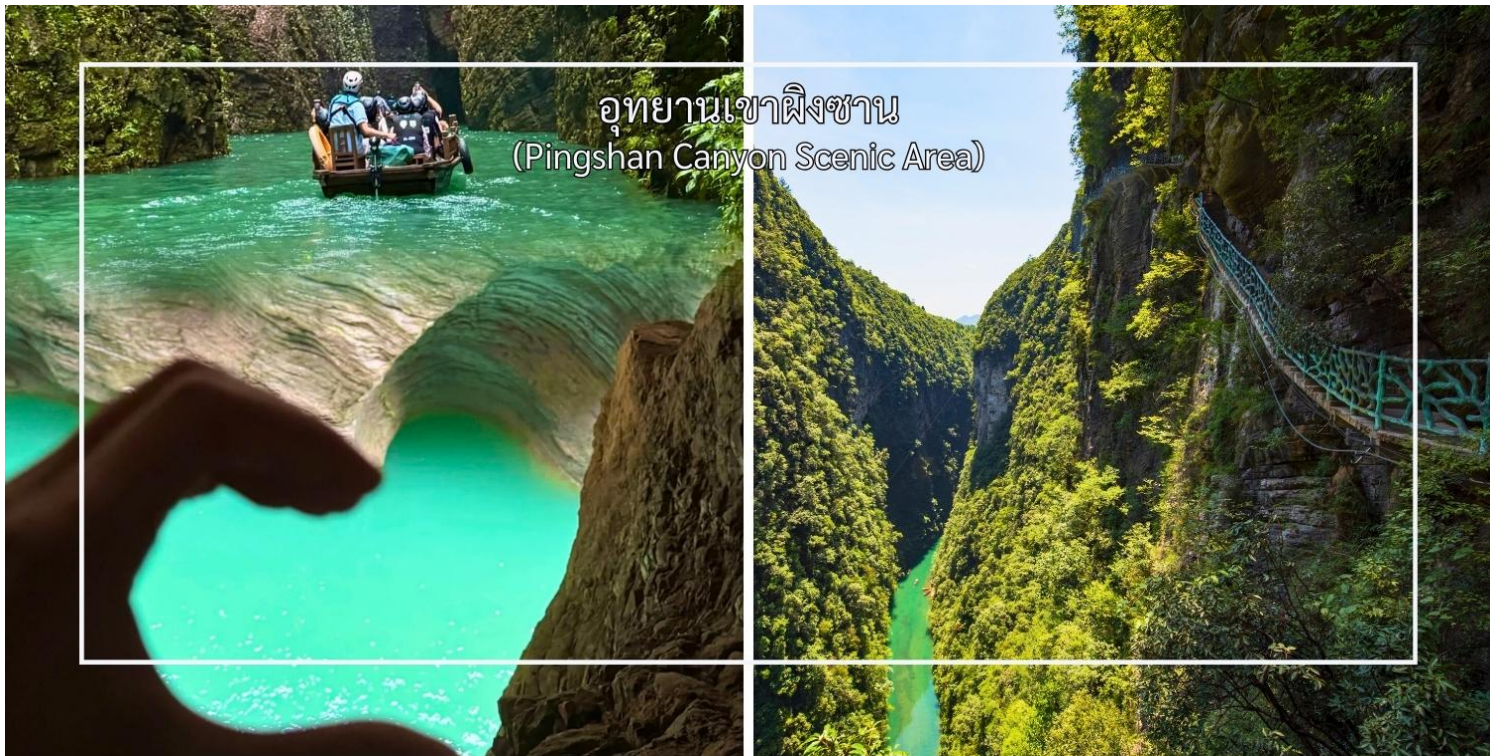
อุทยานเขาผิงซาน (Pingshan Canyon Scenic Area)