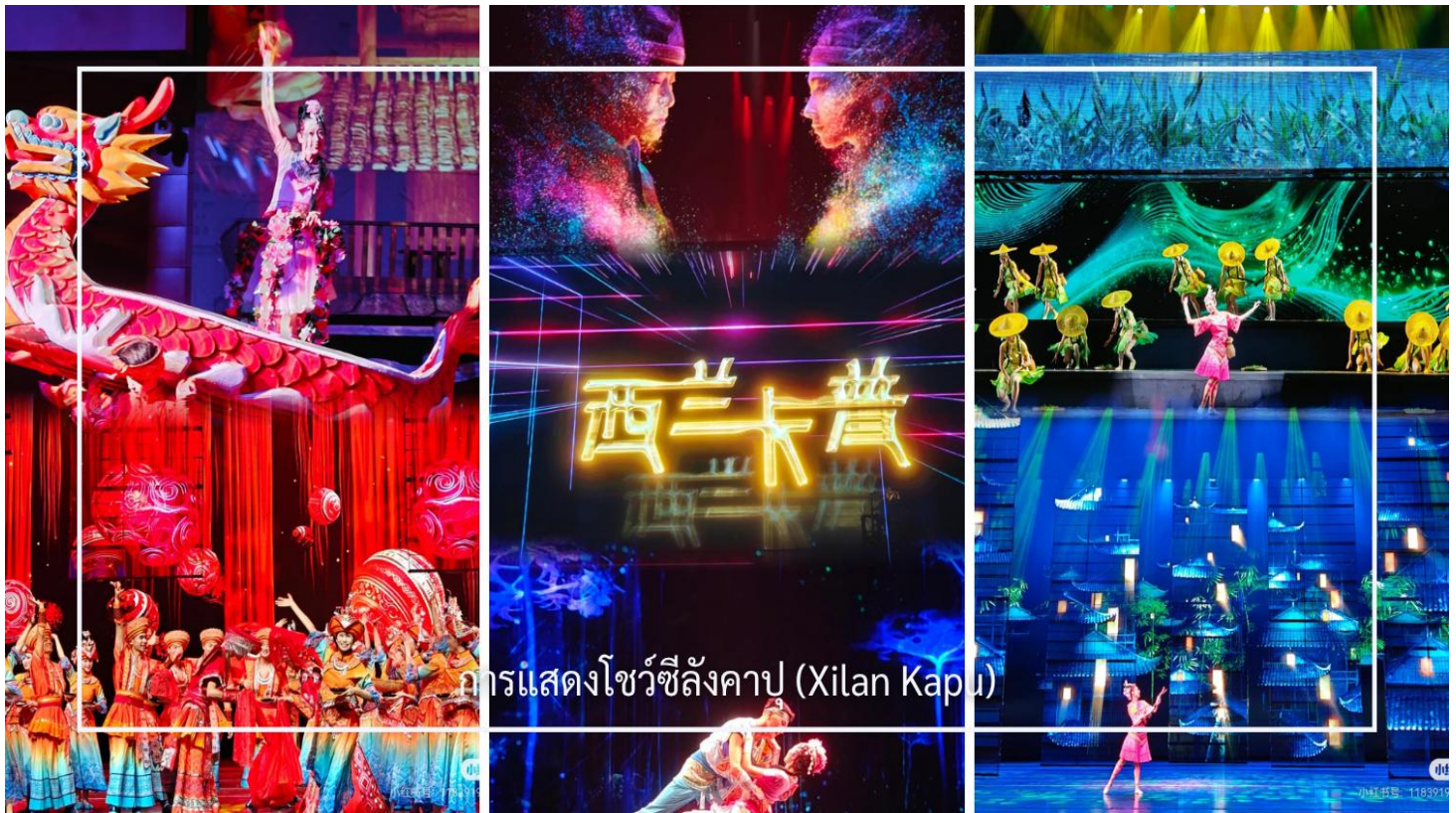
การแสดงโชว์ซีลิ่งคาป (Xilan Kapu)

เดินทางเข้าโรงแรมที่พัก Jinma Hotel ระดับ 4 ดาวหรือเทียบเท่า