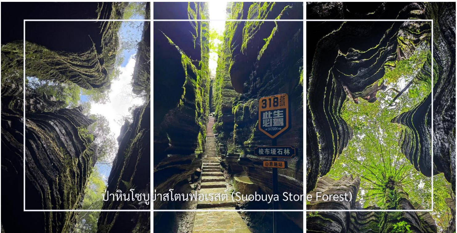
ป่าหินโซบูย่าสโตนฟอเรสต์ (Suobuya Stone Forest)

นำท่านสู่ ป่าหินโซบูย่าสโตนฟอเรสต์ (Suobuya Stone Forest) แหล่งท่องเที่ยวทางธรรมชาติอันน่ามหัศจรรย์ ซึ่งโดดเด่นด้วยกลุ่มหินปูนรูปร่างแปลกตาที่ก่อตัวขึ้นตามธรรมชาติเป็นเวลานานนับล้านปี ภายในพื้นที่เต็มไปด้วยเสาหินสูงตระหง่านเรียงรายสลับซับซ้อน เปรียบเสมือนป่าที่สร้างขึ้นจากหิน ผสานกับบรรยากาศร่มรื่นและเงียบสงบ เหมาะแก่การเดินชมธรรมชาติและเก็บภาพความประทับใจตลอดเส้นทาง