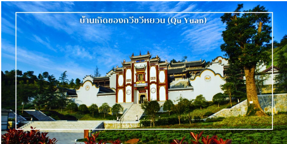
บ้านเกิดของกวีซีเหวียน (Qu Yuan)