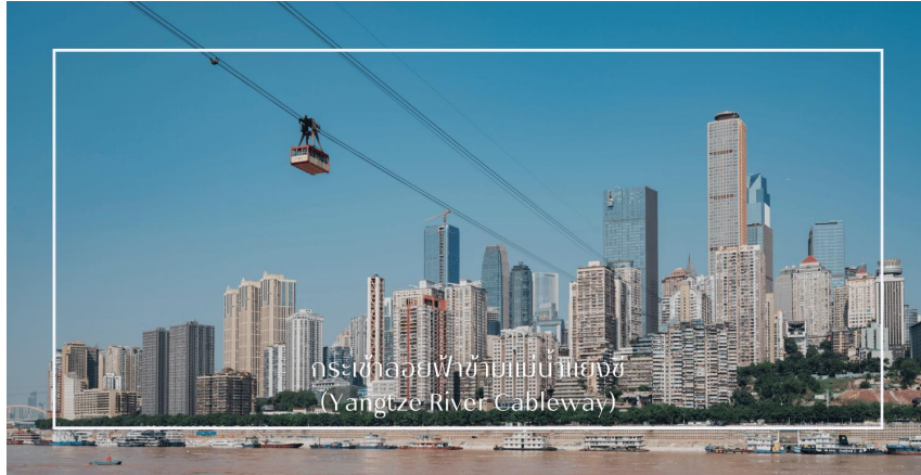
กระเช้าลอยฟ้าข้ามแม่น้ำแยงซี (Yangtze River Cableway)

จากนั้นนำท่านสู่ ปราสาทแห่งความฝันฮวาเซิงหยวน (Hua Sheng Yuan Dream Castle) (รวมบัตรเข้า) หมายเหตุ : ไม่รวมค่ากิจกรรม หนึ่งในแลนด์มาร์กสุดแฟนตาซีแห่งเมืองฉงชิ่ง สถานที่ท่องเที่ยวระดับ 3A ที่ผสมผสานความงดงามของสถาปัตยกรรมสไตล์ยุโรปเข้ากับโลกจินตนาการได้อย่างลงตัว เหมือนได้ก้าวเข้าสู่ปราสาทเทพนิยายในฝัน ที่นี่เต็มไปด้วยมุมถ่ายภาพสวยงามตระการตา พร้อมกิจกรรมหลากหลายไม่ว่าจะเป็นการเยี่ยมชมโรงงานผลิตขนมชื่อดังของฮวาเซิงหยวน โซนทำขนมแบบ DIY และสวนสนุกสำหรับเด็ก นอกจากนี้ในยามค่ำคืน ปราสาทจะส่องประกายด้วยแสงสีสุดอลังการ มอบประสบการณ์เหนือจินตนาการให้แก่ทุกท่าน