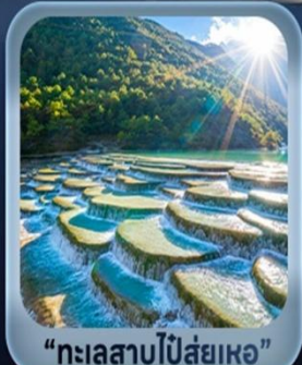
“ทะเลสาบไป๋ซู่เหอ”

ขึ้นกระเช้าใหญ่ชมวิวภูเขาหิมะมังกรหยก + ชมโชว์ความประทับใจลี่เจียง วัดลามะชงจ้านหลิน • ช่องแคบเสื่อกระโจน • เมืองโบราณแซงกรีล่า • ทะเลสาบไป๋ซู่เหอ ร้านกาแฟเมืองเก่าไป๋ชา Yundi'an Coffee • หม่าหยวนมีเตอร์เกจ • วัดหยวนทง