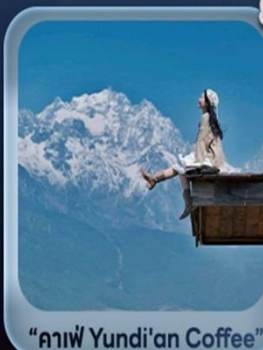
“กาแฟ Yundi'an Coffee”