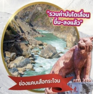
"รวมค่าบัตรเดินรถไฟขึ้น-ลงแล้ว"