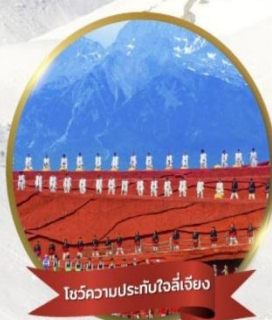
โชว์ความประทับใจลี่เจียง