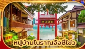
หมู่บ้านโบราณฉือชิว