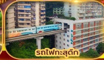
รถไฟฟ้าสุดคูล