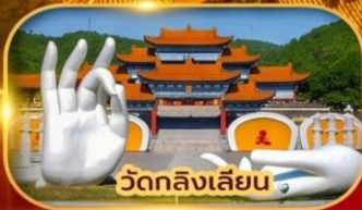
วัดลิ่งเลียน