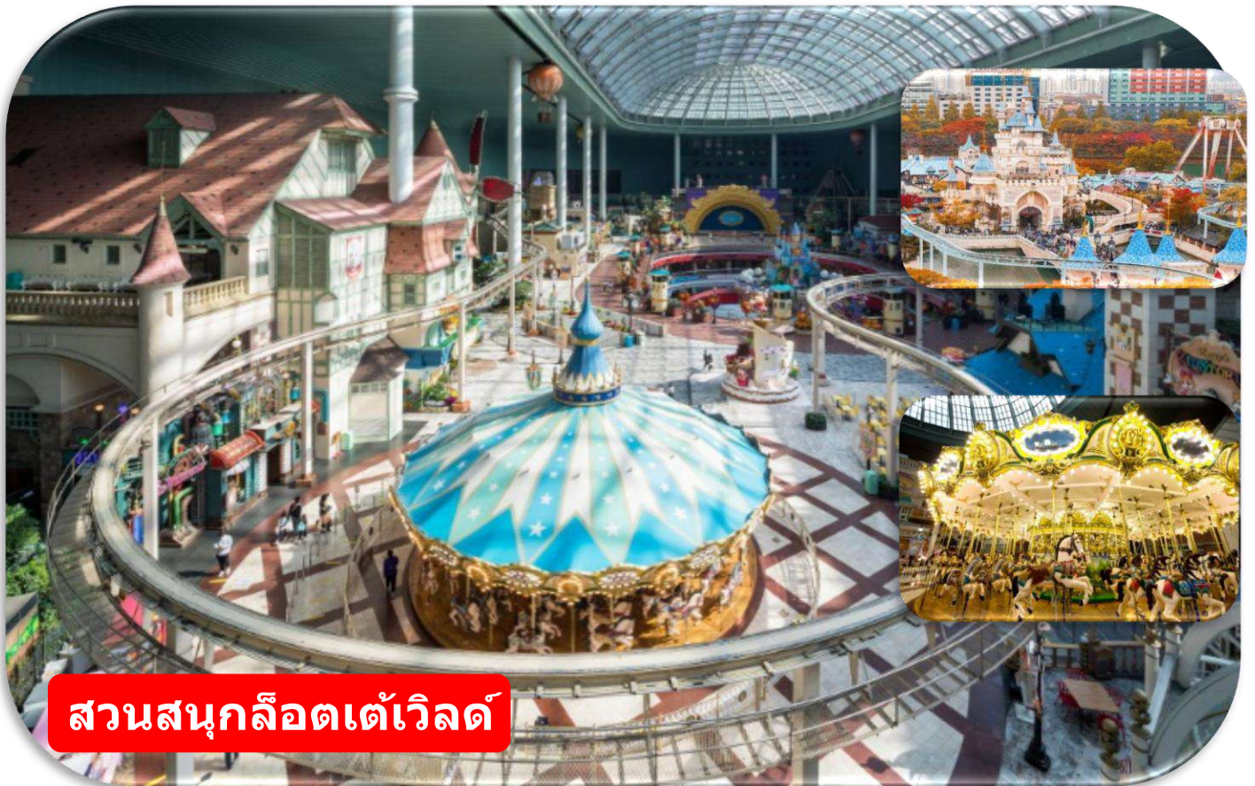
สวนสนุกล็อตเต้เวิลด์

สวนสนุกล็อตเต้เวิลด์ (Lotte World Adventure) รวมค่าเช่า เป็นสวนสนุกในร่มที่ใหญ่ที่สุดในโลกตั้งอยู่ใจกลางกรุงโซล ผสมผสานความสนุกทั้งโซนในร่ม (Adventure) และกลางแจ้ง (Magic Island) เข้าด้วยกันอย่างลงตัว ไฮไลท์คือปราสาทเทพนิยายริมหทะเลสาบ เครื่องเล่นทันสมัย ขบวนพาเหรด และกิจกรรมเที่ยวได้ตลอดทั้งปีไม่ว่าจะแดดออกหรือฝนตก