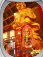
วัดเชกหมิว