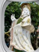
เจ้าแม่กวนอิมวิฬคัมบ์