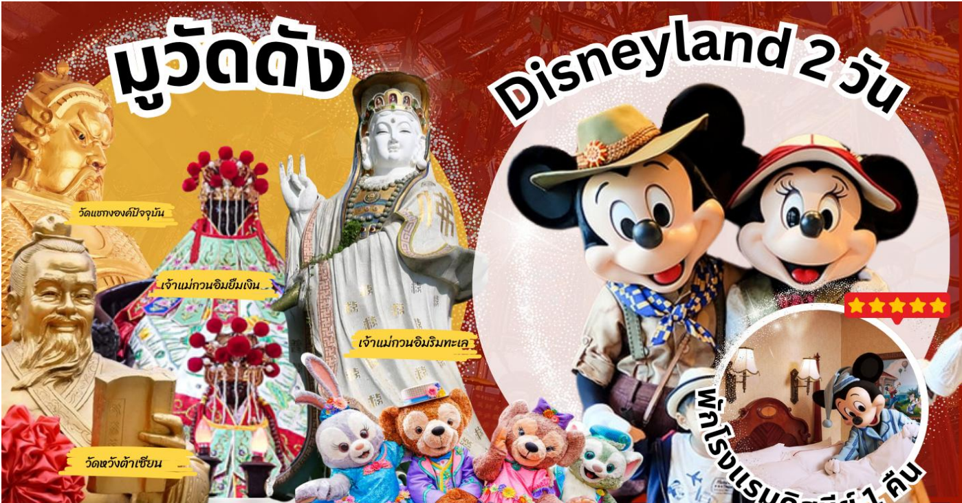
วัดเขาทองคังปัจจุบัน