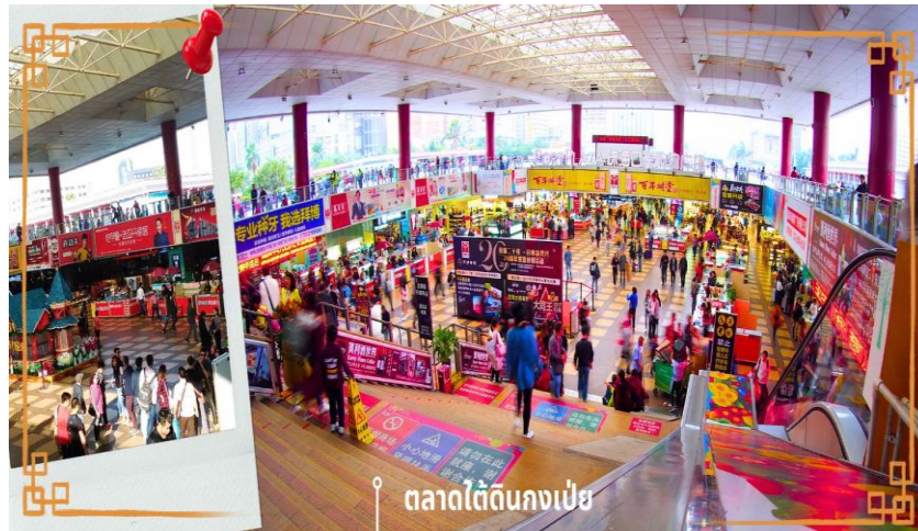
ตลาดใต้ดินกงเป่ย

จากนั้นนำท่าน อิสระช้อปปิ้งตลาดใต้ดินกงเป่ย ตั้งอยู่ติดชายแดนมาเก๊า เป็นศูนย์การค้าดีดแอร์ ที่มีร้านค้ามากกว่า 5,000 ร้านค้า มีสินค้าให้ท่านเลือกมากมาย เช่น สินค้าก๊อปปี้แบรนด์เนมต่างๆ ไม่ว่าจะเสื้อผ้า รองเท้า กระเป๋า นาฬิกา ของเด็กเล่น ฯลฯ ที่นี่ มีสินค้าให้เลือกซื้อหลากหลาย จึงเป็นที่นิยมมากของชาวมาเก๊าและฮ่องกง เนื่องจากสินค้าที่นี่มีคุณภาพและราคาถูก