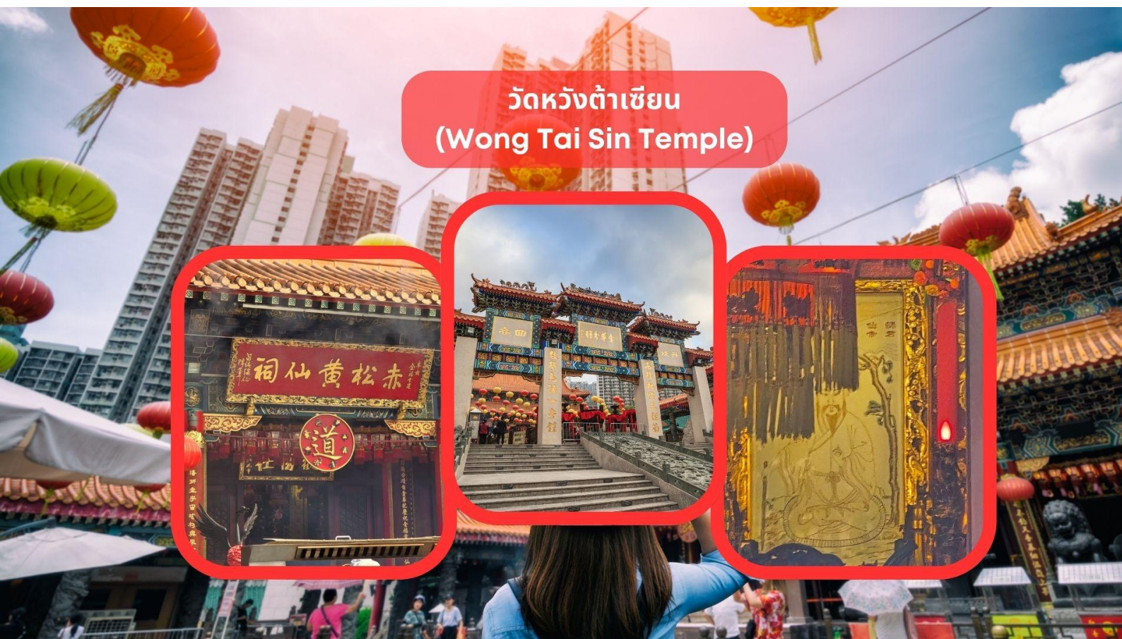
วัดหวังต้าเซียน (Wong Tai Sin Temple)

หลังจากเสร็จพิธี ควรกล่าวคำขอบคุณว่า "ขอบคุณองค์ปักไทที่ประทานพร ข้าพเจ้าจะตั้งใจทำความดีและกลับมา สักการะอีก"