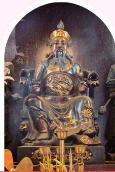
วัดปีกโต เสริมโชคลาก นำพาความรุ่งเรือง