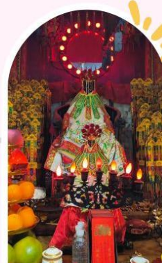
วัดเจ้าแม่กวนอิมฮ่องฮำ ขอพรเรื่องเงิน ทรัพย์สิน และความมั่นคง