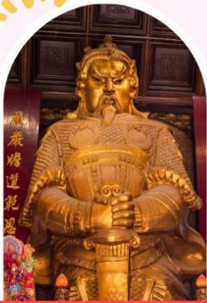
วัดแชกง ขอพรโชคลาก การเงิน และธุรกิจ