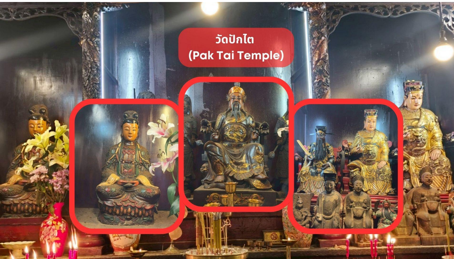
วัดปากไต่ (Pak Tai Temple)

นำท่านเดินทางสู่ วัดปากไต่ (Pak Tai Temple, Hong Hum) เป็นหนึ่งในวัดที่เก่าแก่และสำคัญที่สุดในฮ่องกง โดยสร้างขึ้นเพื่อบูชา เทพเจ้าปากไต่ ซึ่งเป็นเทพเจ้าประจำทิศเหนือ เทพแห่งชัยชนะ ตามความเชื่อในลัทธิเต๋า เทพ