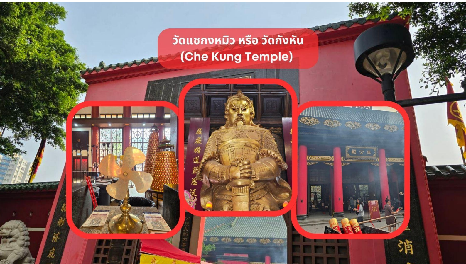
วัดแชกงหมิว หรือ วัดก้งหัน (Che Kung Temple)