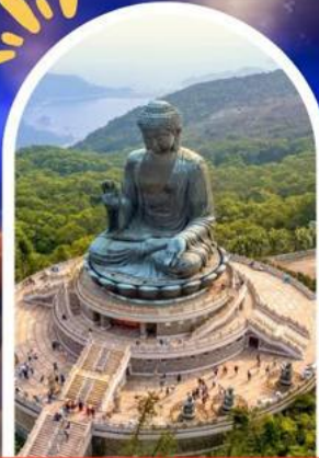
นั่งกระเชานองปิง นมัสการพระใหญ่ไป๋หลิน