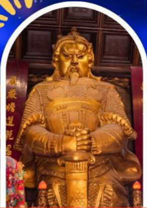
วัดแขก ขอพรโชคลาก การเงิน และธุรกิจ