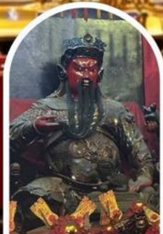
วัดกวนไท่ ขอเทพเจ้ากวนอู ความซื่อสัตย์ เงินทอง ธุรกิจมั่นคง