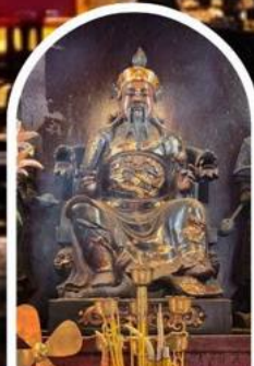
วัดปักไต่ เสริมโชคลาภนำความรุ่งเรืองทุกด้านของชีวิต