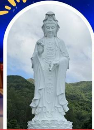
วัดชีซาน ศูนย์รวมพลังงานบวชและอวงจู้ยี่ดี