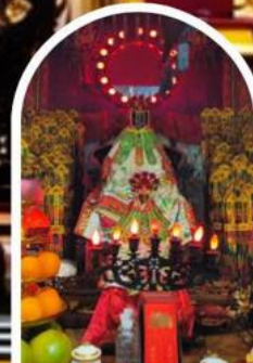
วัดเจ้าแม่กวนอิมฮองฮำ ขอพรเรื่องเงิน ทรัพย์สิน และความมั่งคั่ง