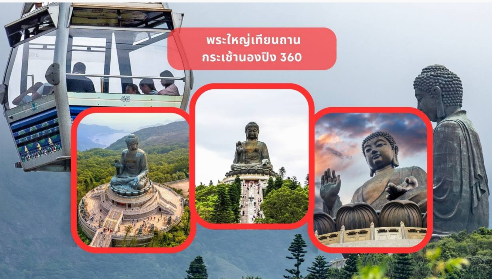
พระใหญ่เกียนถาน กระเข้านองปิง 360