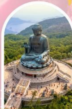
นั่งกระเช้ามองปีง นมัสการพระใหญ่ไป๋หลิน