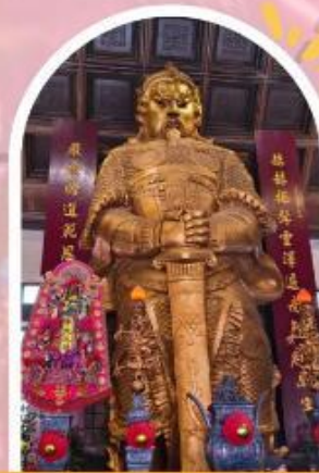
วัดแซกง ขอพรโชคลาภ การเงิน และธุรกิจ