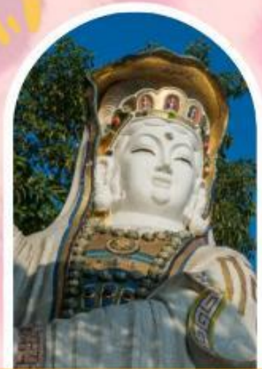
ริฟลัสเบย์ รับพลังงานดี เสริมพลังดวงจัญ