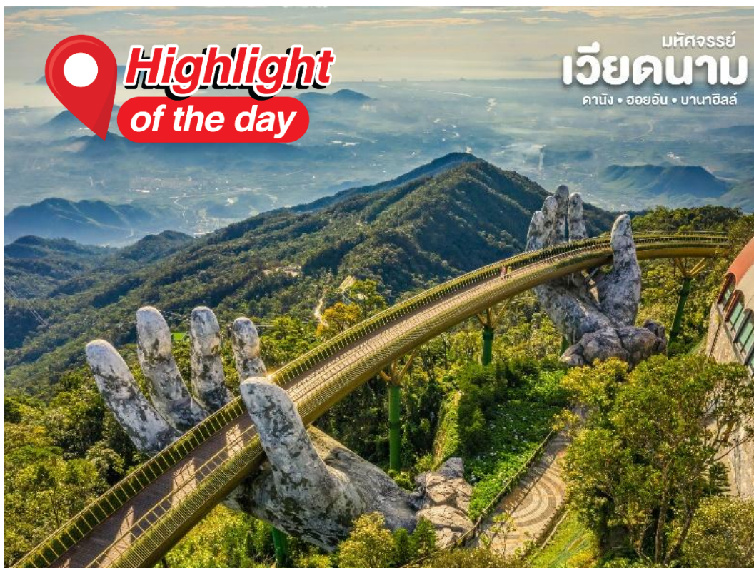
มหัศจรรย์ เวียดนาม คานัง • ฮอยอัน • บานาฮิลล์

นำท่านชม สะพานสีทอง สถานที่ท่องเที่ยวใหม่ล่าสุดตั้งโดดเด่นเป็นเอกลักษณ์อย่างสวยงาม บนเขาบานาฮิลล์ นำท่านสู่จุดที่สร้างความตื่นตะลึงให้นักท่องเที่ยวมองดูอย่างอึ้งการที่ซึ่งเต็มไปด้วยเสน่ห์แห่งตำนานจนถึงระทึกขวัญ สิ้นประสาทอีกมากมาย หรือ ซ้อปั้งซ้อของที่ระลึกภายในสวนสนุกอย่างจุใจและอีกมากมายที่รอท่านพิสูจน์ความมันส์กันอย่างเต็มที่ให้ท่านได้สนุกสนานไปกับเครื่องเล่นนานาชนิดอย่างจุใจ