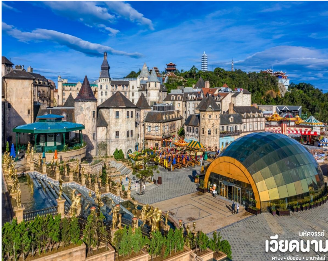
มหัศจรรย์ เวียดนาม คานัง • ฮอยอัน • บานาฮิลล์

นำท่านชม สะพานสีทอง สถานที่ท่องเที่ยวใหม่ล่าสุดตั้งโดดเด่นเป็นเอกลักษณ์อย่างสวยงาม บนเขาบานาฮิลล์ นำท่านสู่จุดที่สร้างความตื่นตะลึงให้นักท่องเที่ยวมองดูอย่างอึ้งการที่ซึ่งเต็มไปด้วยเสน่ห์แห่งตำนานจนถึงระทึกขวัญ สิ้นประสาทอีกมากมาย หรือ ซ้อปั้งซ้อของที่ระลึกภายในสวนสนุกอย่างจุใจและอีกมากมายที่รอท่านพิสูจน์ความมันส์กันอย่างเต็มที่ให้ท่านได้สนุกสนานไปกับเครื่องเล่นนานาชนิดอย่างจุใจ