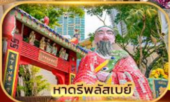
หอดรฟ์ลิสเบย์