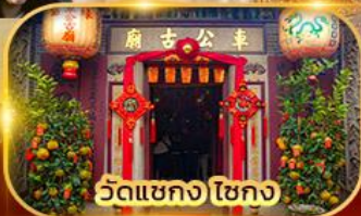
วัดเขากง ไชกง