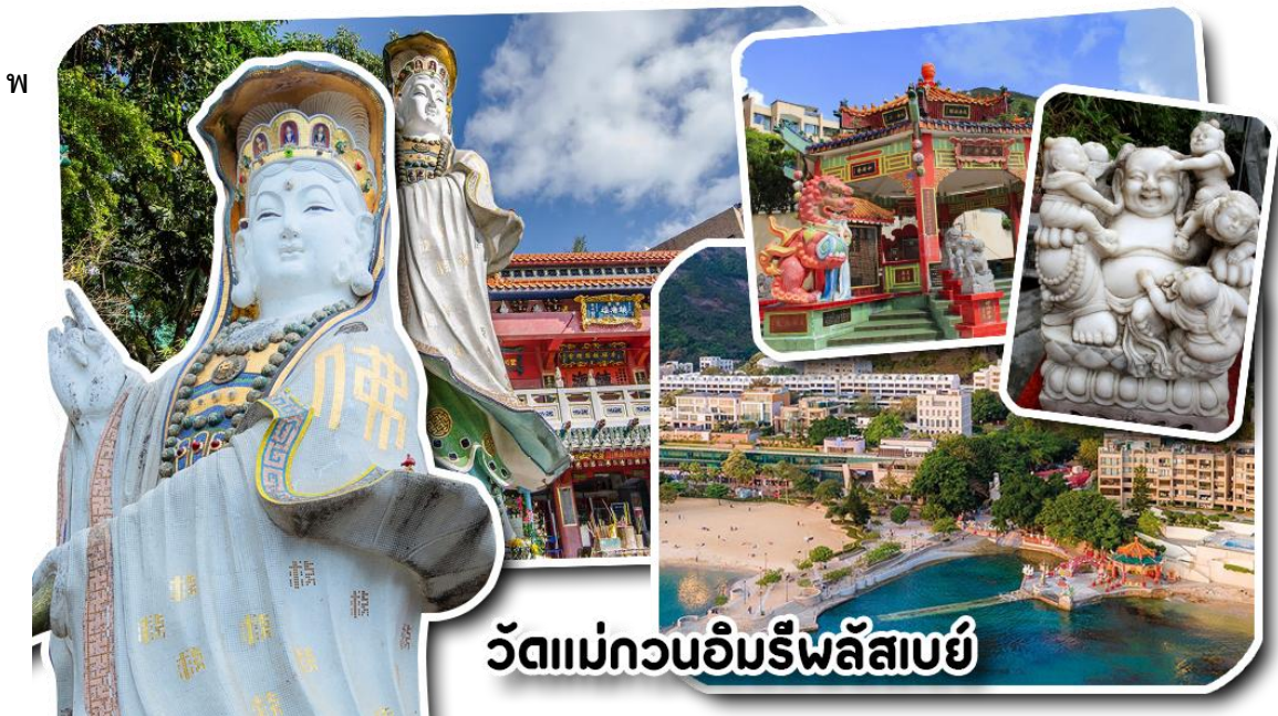
วัดแม่กวนอิมรีฟลัสเบย์

จากนั้นพาท่านเดินทางต่อไปยัง วัดแม่กวนอิมริมหาดรีฟลัสเบย์ วัดแห่งนี้ถูกสร้างขึ้นเพื่อคุ้มครองชาวประมงเวลาออกเรือไปหาปลาในสมัยก่อน บริเวณวัดมีสิ่งศักดิ์สิทธิ์มากมาย ได้แก่ เจ้าแม่กวนอิม ประดิษฐานอยู่ทางด้านซ้ายของวัด ซึ่งผู้นิยมเดินทางไปกราบไหว้ขอพรเรื่องการมีบุตร และยังมีพระสังกัจจายที่เชื่อกันว่าสามารถขอเพศของบุตรที่จะมาเกิดได้ โดยหลังจากกราบไหว้แล้วก็ให้ลูบที่ท้องของพระสังกัจจาย ถ้าอยากได้ลูกชายให้ลูบท้องซ้าย อยากได้ลูกสาวให้ลูบท้องขวา ถัดมาคือเจ้าแม่ทับทิมเทพีแห่งท้องทะเล ท่านจะคอยคุ้มครองผู้เดินทางทางเรือ หรือผู้ที่เดินทางไปไหนมาไหนท่านจะคอยคุ้มครองให้ปลอดภัย และมีโชคลาภ ถัดจากบริเวณที่กราบไหว้ขอพร ก็จะมีศาลาแปดเหลี่ยมริมน้ำ และสะพานเล็กๆ ที่ชื่อว่าสะพานต่ออายุ ซึ่งเชื่อกันว่าหากเดินข้ามสะพานแห่งนี้ 1 ครั้ง ก็จะมีอายุยืนขึ้น 3 ปี