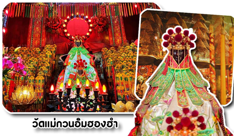
วัดแม่กวนอิมฮ่องฮำ

พาท่านเดินทางไปไหว้ขอพรขอเงิน วัดแม่กวนอิมฮ่องฮำ วัดเก่าแก่ของฮ่องกงสร้างตั้งแต่ปี ค.ศ. 1873 เป็นวัดขนาดเล็กที่มีชาวฮ่องกงศรัทธานับถือกันเป็นอย่างมาก วัดแห่งนี้เป็นที่ประดิษฐาน องค์เจ้าแม่กวนอิมฮ่องฮำ ที่มีชื่อเสียงเรื่องการให้กู้ยืมเงิน เชื่อกันว่าท่านช่วยพลิกฟื้นเศรษฐกิจของชาวฮ่องกง ผู้คนจึงนิยมมาเยี่ยมเงินทำธุรกิจจนสำเร็จร่ำรวย รุ่งเรือง โดยให้ท่านอธิษฐานขอพรต่อหน้าเจ้าแม่กวนอิมฮ่องฮำ พร้อมกับระบุวันเวลาในการขอพรด้วย จากนั้นนำธูปตามฐานะและศรัทธาที่เราจะนำเป็นสื่อในการขอพร เขียนจำนวนเงินที่ต้องการลงไปด้วย ใส่สกุลเงินยิ่งดีใหญ่ แล้วนำเงินใส่ในซองแดง ควรเตรียมซองแดงไปเอง นำซองแดงไปวนรอบกระถางธูป วนขวาจำนวน 3 ครั้ง แล้วเก็บซองแดงในกระเป๋าสตางค์ เป็นเงินขวัญถุง ถ้าประสบความสำเร็จตามที่มุ่งหวังให้นำเงินในซองแดงทำบุญหยอดตู้ที่วัดแห่งนี้ในโอกาสต่อไป วิธีไหว้ให้ปัง ให้ได้โชคลาภเงินทอง ต้องไปกับเราเท่านั้น