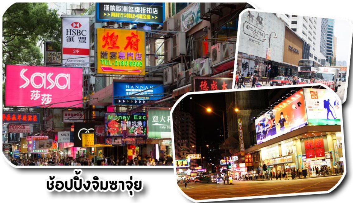
ช้อปปิ้งจิมซาจุย

จากนั้นพาท่าน ช้อปปิ้ง ย่านจิมซาจุย (tsim sha tsui) เป็นย่านช้อปปิ้งชื่อดังของเกาะฮ่องกง ที่คนไทยทั่ว ๆ ไปก็ต้องรู้จัก และพูดกันหนาหูติดปากมานาน ตั้งอยู่บริเวณริมอ่าววิกทอเรีย ของฝั่งเกาลูน ฮ่องกง เมื่อพูดถึงจิมซาจุย ทุกคนก็ต้องนึกถึงถนนนาธาน ซึ่งทอดยาวตั้งแต่จิมซาจุยไปจนถึงย่านปรีนซ์ เอ็ดเวิร์ด นับเป็นถนนสายช้อปปิ้งอย่างแท้จริง และเป็นเสน่ห์อย่างหนึ่งของฮ่องกง ที่ทั้งสองฟากฝั่งของถนนจะเต็มไปด้วยร้านค้าต่าง ๆ มากมาย ทั้งเสื้อผ้าแบรนด์เนมชื่อดังทั่วโลก เครื่องหนังชั้นดี ห้างสรรพสินค้าทันสมัย ร้านอาหารและภัตตาคารสุดหรู โรงแรมตั้งแต่ระดับเกสต์เฮาส์ ไปจนถึงระดับ 5 ดาว นำท่านช้อปปิ้ง POPMART เอาใจสาวกฮาร์ตทอย...ตามล่าบูบี้ และมีให้เลือกทั้ง Kubo / Molly/ Hirono / Disney Pixar / Labubu และอีกมากมาย