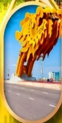
สะพานมังกรคาบิง