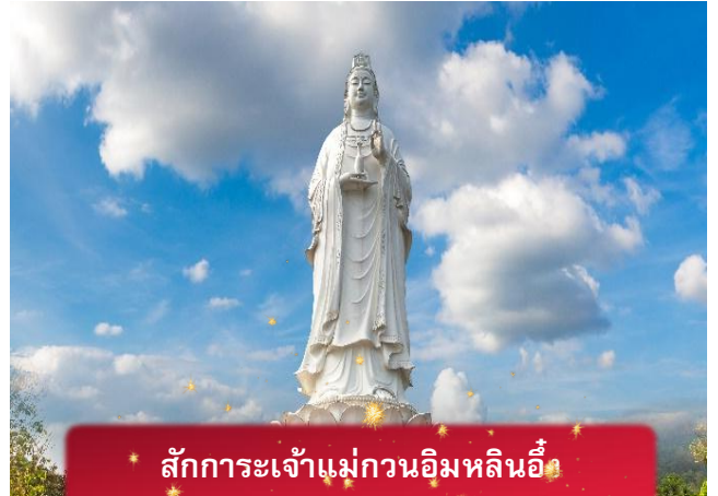
สักการะเจ้าแม่กวนอิมหลินอึ้ง