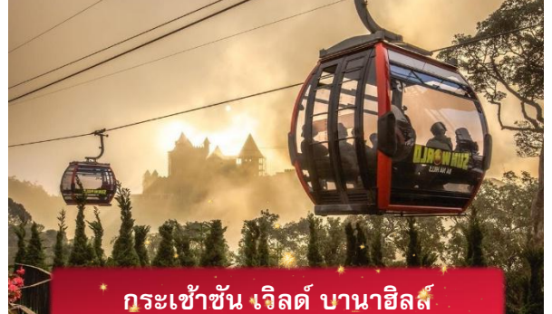
กระเช้าชั้น เวิลด์ บานาฮิลล์

บริการอาหารเช้า ณ ห้องอาหารของโรงแรม นำท่านชม สะพานมั่งกร ความอลังการกลางเมือง เวียดนาม เป็นสัญลักษณ์ที่โดดเด่นของเมืองดานัง นำท่าน เดินทางสู่ บานาฮิลล์ แหล่งรวมความสนุกและความ บันเทิงบนยอดเขาสูง อยู่ห่างจากตัวเมืองดานังประมาณ 40 กิโลเมตร เดิมเคยเป็นสถานที่พักผ่อนตากอากาศของ ชาวฝรั่งเศส