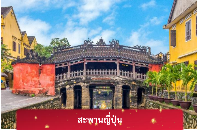
สะพานญี่ปุ่น

จากนั้นนำท่านเดินทางสู่ เมืองโบราณฮอยอัน เมืองมรดกโลกที่ยังคงเอกลักษณ์และรักษาวัฒนธรรมไว้อย่างดีเยี่ยม โดยท่านสามารถเดินเล่น ถ่ายรูป ตามตรอกซอกซอยต่างๆ ได้ ไฮไลท์ของการมาถ่ายรูปเช็คอินที่นี่คือการได้ขึ้นไปถ่ายรูปจากมุมสูงของคาเฟ่ที่อยู่ตามซอกซอย ได้ทั้งวิว ได้ทั้งชิมกาแฟรสชาติออริจินัลของเวียดนาม