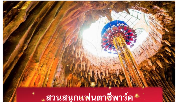
สวนสนุกแฟนตาซีพาร์ค

อิสระท่านท่องเที่ยว สวนสนุกแฟนตาซีพาร์ค ซึ่งมีเครื่องเล่นหลากหลายรูปแบบ เช่น ทำทายความมันส์ของหนัง 4D ระทึกขวัญกับบ้านผีสิง เกมส์สนุกๆ เครื่องเล่นเบาๆ รถบั้ง หรือจะเลือกซื้อป๊อปปิ้งของที่ระลึกของสวนสนุก และ จัตุรัสแห่งดวงดาว เปรียบเสมือนการเดินทางสู่อาณาจักรแห่งดวงดาวที่มีเส้นทางเชื่อมต่อระหว่างอาณาจักรแห่งดวงจันทร์และอาณาจักรแห่งดวงอาทิตย์ถนนที่แสนงดงาม และสถาปัตยกรรมที่ล้ำสมัยจุดเด่นของที่แห่งนี้ก็คือจุดคือกระจกใสทรงสามเหลี่ยมที่ดูคล้ายกับพิพิธภัณฑสถานลูฟวร์ที่ฝรั่งเศส ให้ความรู้สึกเหมือนท่านกำลังท่องอยู่ในโลกแห่งเวทมนต์และดวงดาว (ไม่รวมค่าเข้าชมหุ่นขี้ผึ้ง)