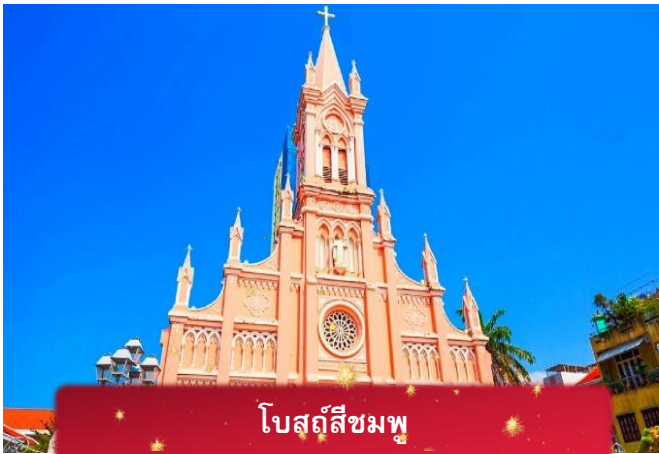
โบสถ์สีชมพู

บริการอาหารค่ำ ณ ภัตตาคาร พิเศษ ... เมนูบุฟเฟ่ต์ปิ้งย่าง MAGNOLIA HOTEL เทียบเท่าหรือระดับ 4 ดาวท้องถิ่น