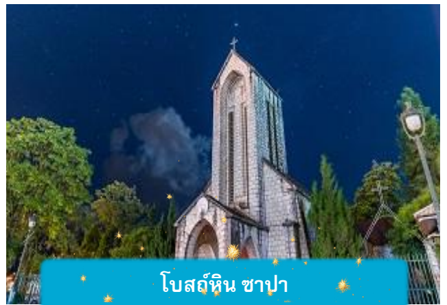
โบสถ์หิน ซาปา