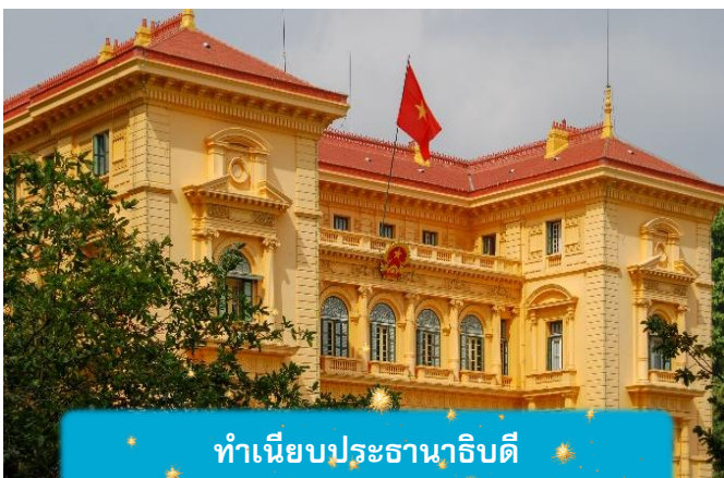
ทำเนียบประธานาธิบดี