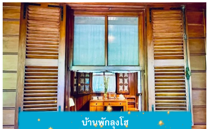
บ้านพักลุงโฮ