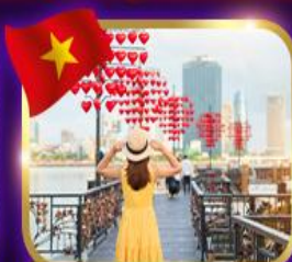
เซ็คอินสะพานแห่งความรัก