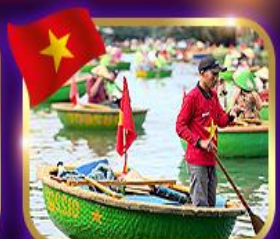
เรือกระด้ง หมู่บ้านกิมทาน