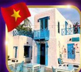
คาเฟ่สุดชิค ซานทรา มารีน่า