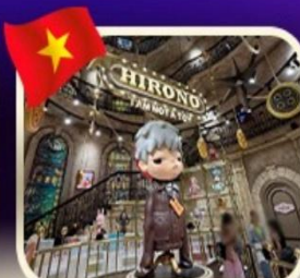
POPMART บานาฮิลล์