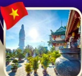
ขอพรกวนอิมวัดหลันอึ้ง