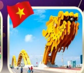
สะพานมังกร ดานัง