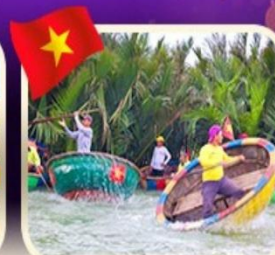
ล่องเรือกระด้งกัมทาน