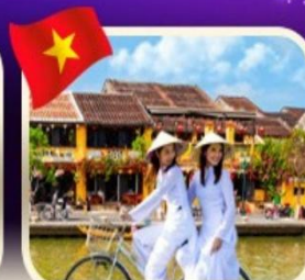
เช่าจักรยานเมืองเก่าฮอยอัน