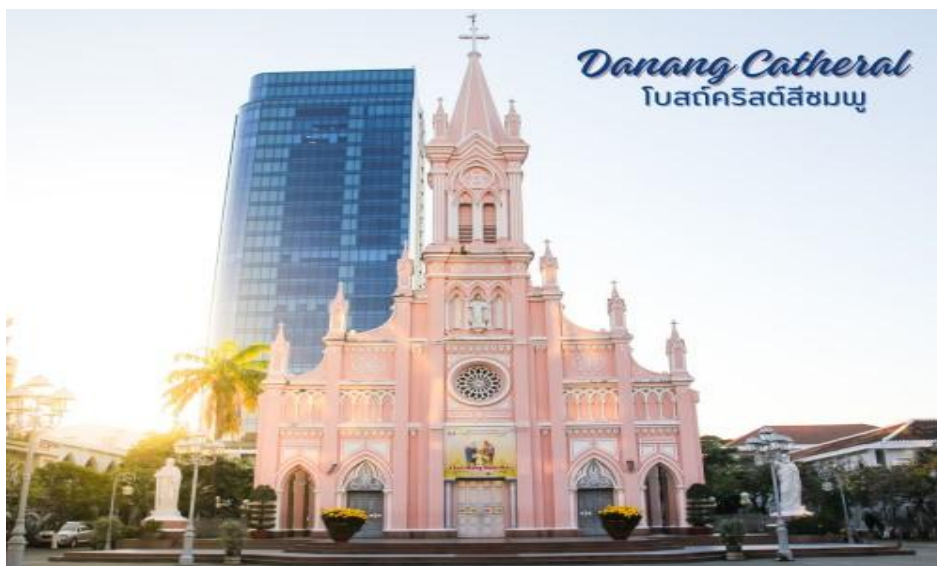
Danang Cathedral โบสถ์คริสต์สิชมพู่

นำท่านแวะ ร้านกาแฟ Palm Beach อิสระในการเลือกซื้อสินค้า กาแฟต่างๆ เช่น กาแฟชี่ชะมัด กาแฟชี่ซ่าง กาแฟดริบ ผลิตภัณฑ์จากกาแฟ เป็นต้น