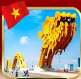
สะพานมังกร ดำนัง