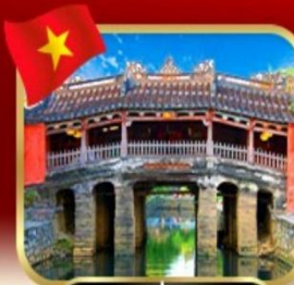
สะพานญี่ปุ่นโบราณ