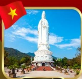
วัดหลินอั้ง