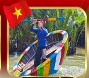
ล่องเรือกระดงที่บานา