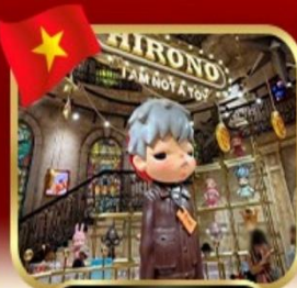
popmart บานาฮิลล์