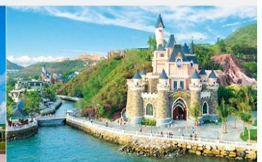
สวนสนุกวินวันเดอร์ส

*ทางบริษัทฯ ขอสงวนสิทธิ์ในการสลับโปรแกรมทัวร์ตามความเหมาะสมขึ้นอยู่กับสถานการณ์หน้างาน โดยคำนึงถึงผลประโยชน์ของลูกค้าเป็นสำคัญ