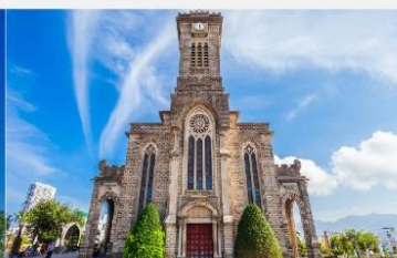
โบสถ์หินญาจาง